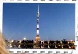
พิเศษ! ทานอาหาร ชมวิว Panorama ที่ตึก Ostankino Tower