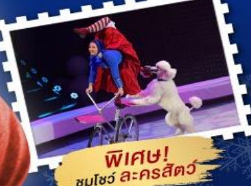
พิเศษ! ชมโชว์ สະครสัศตว์