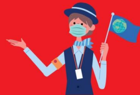
ไกด์ใส่แมสตลอดเวลา