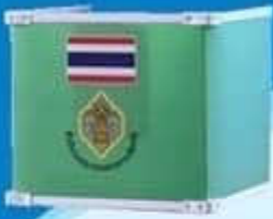
คูหาเลือกตั้ง