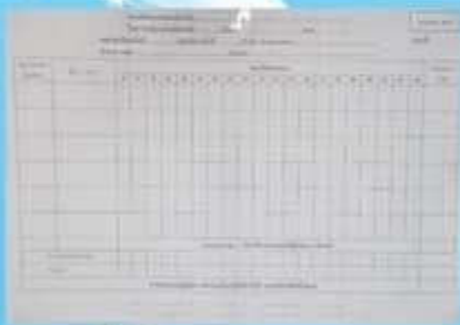
แบบขีดคะแนน