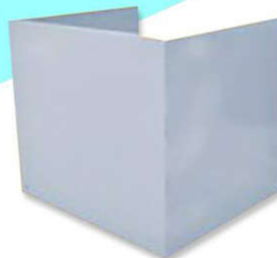
ตู้หีบบัตร