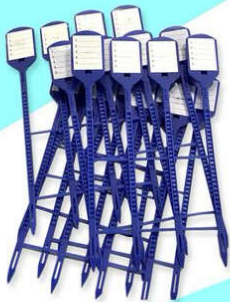
สายรัดทึบ รหัส 44490324