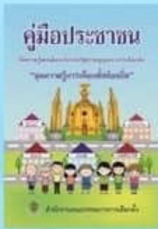
คู่มือประชาชน