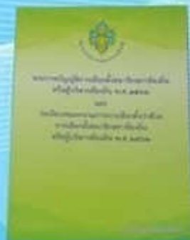
หนังสือกฎหมาย ระเบียบการเลือกตั้ง