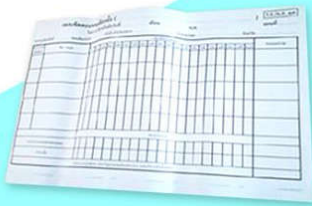
กระดาษขีดคะแนน