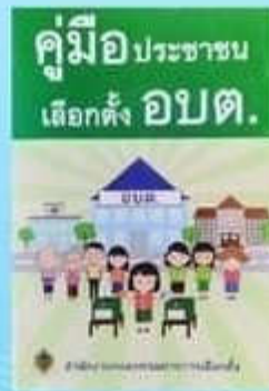
คู่มือประชาชน เลือกตั้ง อบต.