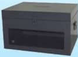
หีบเลือกตั้งพลาสติก