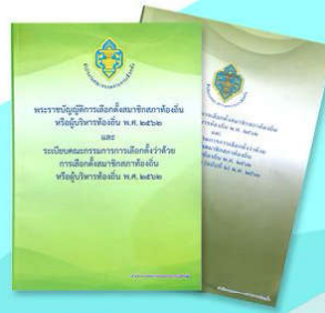
รวมกฎหมาย ระเบียบ ประกาศการเลือกตั้ง