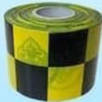
แถบแนวกั้นพลาสติก