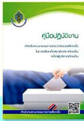
คู่มือ กปน.