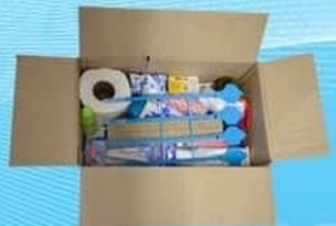
อุปกรณ์การเลือกตั้ง