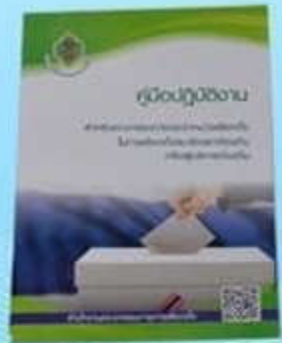
หนังสือคู่มือปฏิบัติงาน