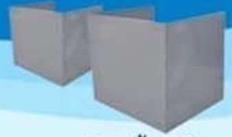
คูหาเลือกตั้งเหล็ก