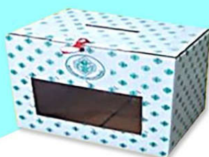
ตู้หีบบัตร รหัส 44490355