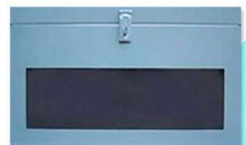
ตู้หีบบัตร