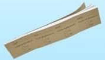
กระดาษจดลำดับที่