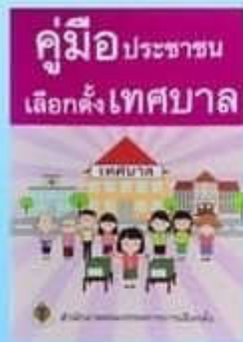
คู่มือประชาชน เลือกตั้งเทศบาล