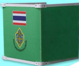
ตู้หีบบัตร รหัส 04008279