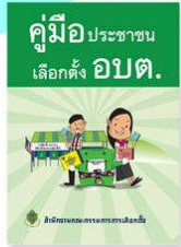
คู่มือประชาชน เลือกตั้ง อบต.