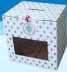
หีบเลือกตั้งกระดาษ