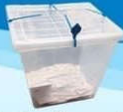
หีบเลือกตั้งพลาสติก