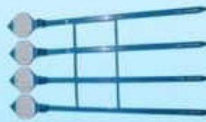
สายรัดหีบบัตรเลือกตั้ง