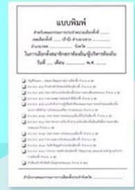
แบบพิมพ์สมุดรายงานเหตุการณ์ ประจำหน่วยเลือกตั้ง นายก/สมาชิก (แบบมีก๊อปปี้นในตัว)