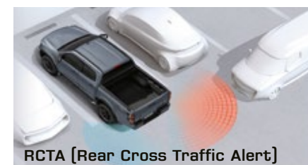
RCTA [Rear Cross Traffic Alert]