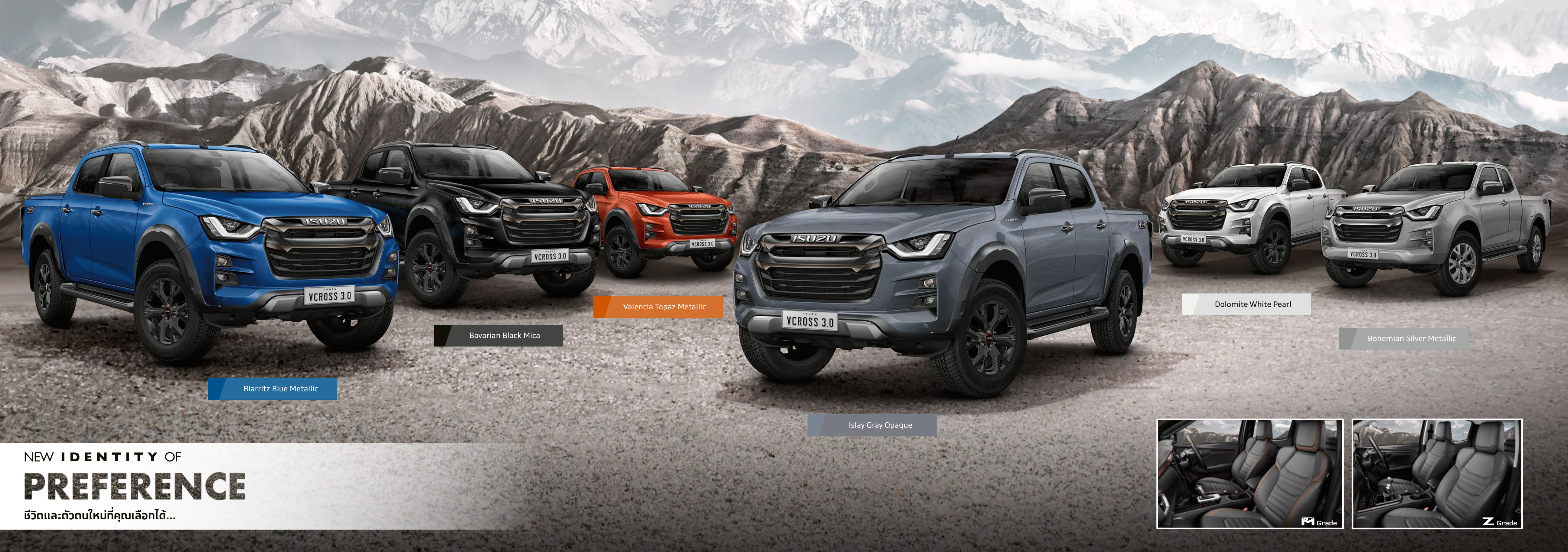
Biarritz Blue Metallic