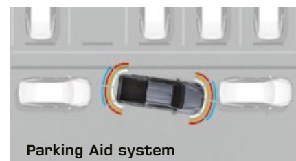
Parking Aid system