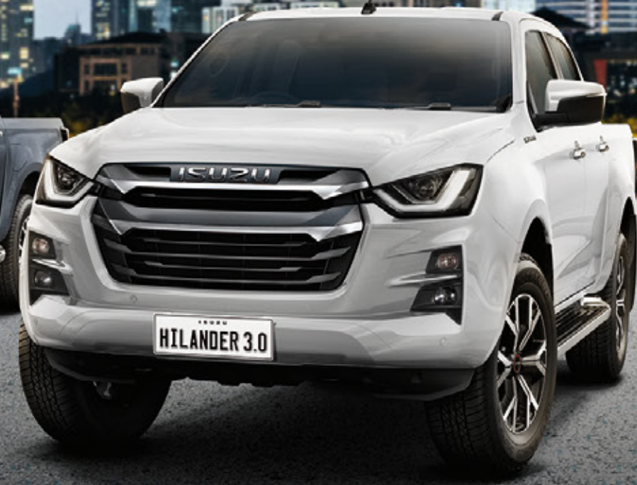
Dolomite White Pearl