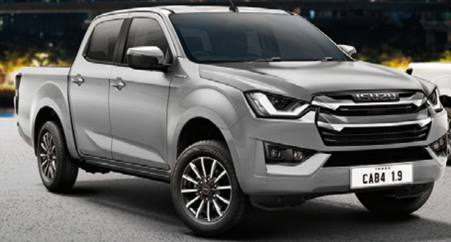
Bohemian Silver Metallic