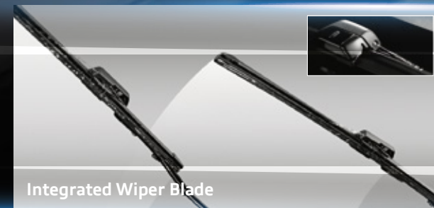
Integrated Wiper Blade