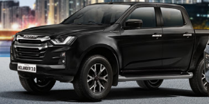
Bavarian Black Mica