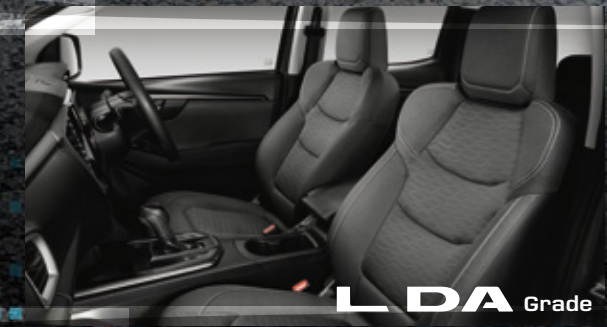
L DA Grade