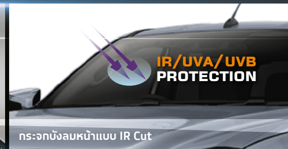
กระจกบังลมหน้าแบบ IR Cut