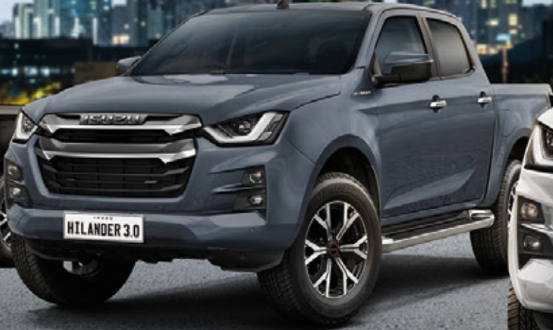
Islay Gray Opaque