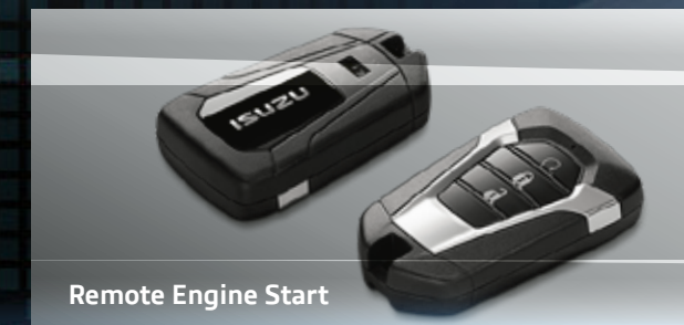
Remote Engine Start