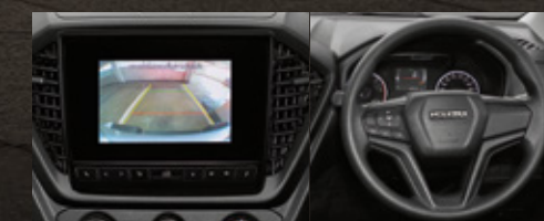
ใหม่ ! ห้องโดยสารในรุ่น S DA