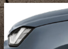
Islay Gray Opaque

หลากหลายเลือกได้ ในแบบที่ตอบโจทย์ธุรกิจคุณ