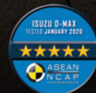
มาตรฐานความปลอดภัยระดับ 5 ดาว จาก ASEAN NCAP