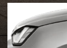
Bohemian Silver Metallic