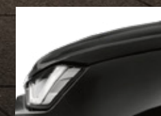
Bavarian Black Mica