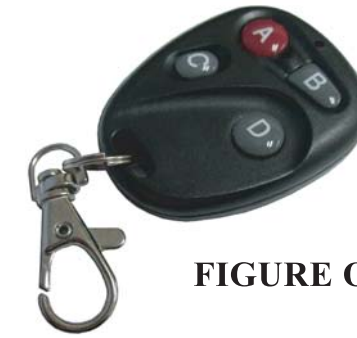
FIGURE OF UHF REMOTE CONTROL

หมายเหตุ: ก่อนใช้งาน จะต้องใส่ถ่านที่ตัวรีโมทก่อน (ใส่ถ่านรุ่น 27A ขนาด 12 โวลต์ ไม่มีให้ภายในชุด) โดยขันน็อตด้านหลังตัวรีโมทออกก่อน