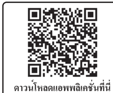
ดาวน์โหลดแอปพลิเคชันที่นี่