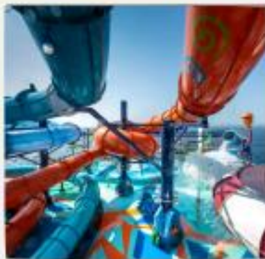
Ocean Cay Aquapark