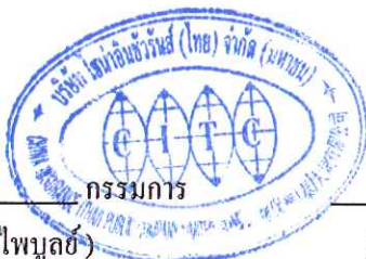
(นายแอรอน ตัน เวย เถิง)