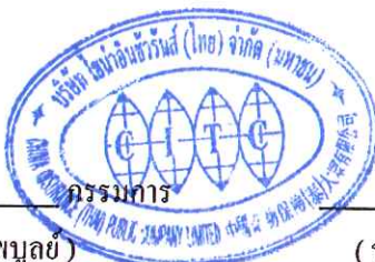
(นายเอรอน ตัน เวจ เริง)