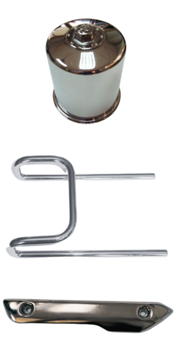
กลุ่มยานยนต์ ชิ้นส่วนตกแต่ง ภายใน-ภายนอก