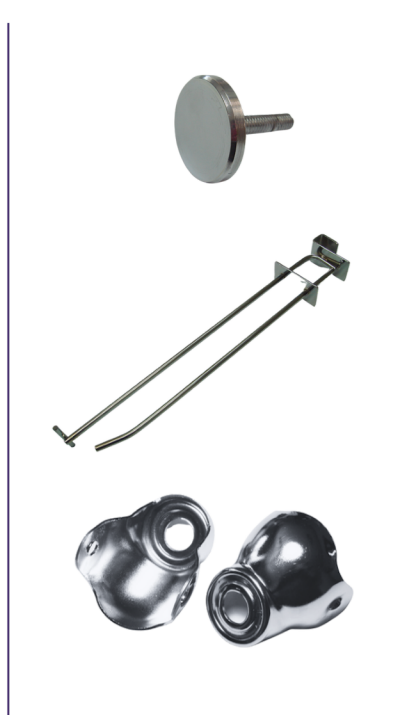
กลุ่มเฟอร์นิเจอร์ มือจับ ราวแขวน ชาลิ้อ