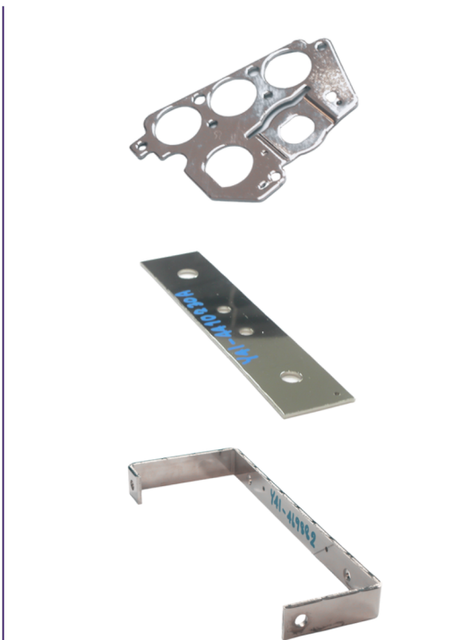
กลุ่มอิเล็กทรอนิกส์ ชิ้นส่วนประกอบ