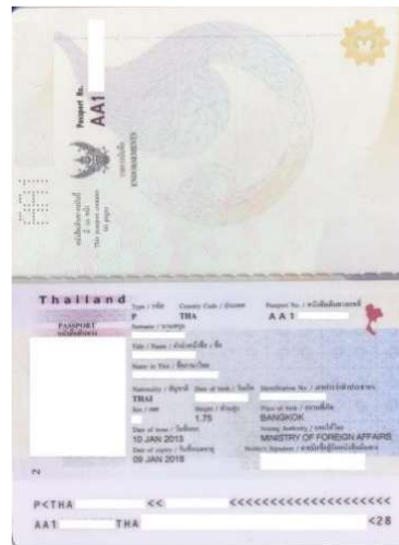
ตัวอย่างรูปถ่าย และสำเนาหนังสือเดินทาง