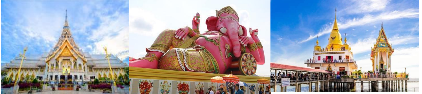
เดินทางโดยรถตู้ปรับอากาศ

วัดสมานรัตนาราม - วัดปากน้ำโจโล - ตลาดบ้านใหม่ - วัดโสธรวรารามวรวิหาร ท่าข้ามคาเฟ้ - วัดหงษ์ทอง