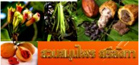
สวนสมุนไพร ศรีลังกา