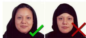
Hairline Showing Hairline Covered