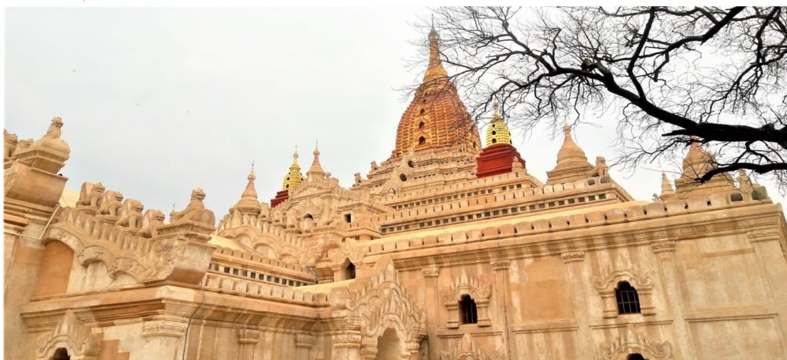
ชมเจดีย์ติโลมินโล เจดีย์แห่งนี้ได้รับการยกย่องว่ามีความสวยงามมากทั้งภายในและภายนอก วัดนี้สร้างแบบก่ออิฐถือปูน บน

เช้า บริการอาหารเช้าในห้องอาหารของโรงแรม นำท่านชม ตลาดของอุ ตลาดใหญ่ของเมืองพุกามที่ขายสินค้าทุกชนิดทั้งเครื่องอุปโภค-บริโภค ข้าวปลาอาหาร ผักสด เสื้อผ้า ของที่ระลึกพื้นเมืองเหมาะสำหรับเดินชมและเลือกซื้อของฝากโดยเฉพาะเครื่องเงินที่พุกามถือว่าเป็นหนึ่งเพราะฝีมือปราณีตและออกแบบสวย นำชม วัดอนันดา(Ananda Temple) เป็นวัดสีขาว มองเห็นได้ชัดเจนสร้างเสร็จเมื่อปี 1091 ซึ่งวิหารแห่งนี้นับได้ว่าเป็นวิหารที่มีขนาดใหญ่ที่สุดในพุกาม มีรูปร่างเป็นสี่เหลี่ยมจัตุรัส มีมุขเด็จยื่นออกไปทั้ง 4 ด้าน แผนผังเหมือนไม้กางเขนแบบกรีก ซึ่งต่อมาเจดีย์แห่งนี้เป็นต้นแบบของสถาปัตยกรรมพม่าในยุคต้นของพุกาม และสิ่งที่น่าสนใจของวิหารแห่งนี้ก็คือ ที่ช่องหลังคาเจาะเป็นช่องเล็กๆ ให้แสงสว่างส่องลงมาต้ององค์พระ ทำให้มีแสงสว่างอย่างน่าอัศจรรย์