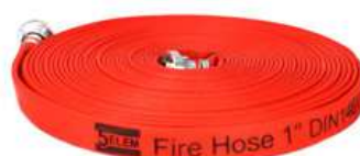
Fire Hose - DIN 14811