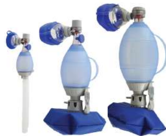
เครื่องช่วยหายใจชนิดมือบีบ ผลิตภัณฑ์ AMBU