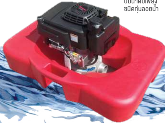
ปั้มน้ำดับเพลิง ชนิดกุนลอยน้ำ