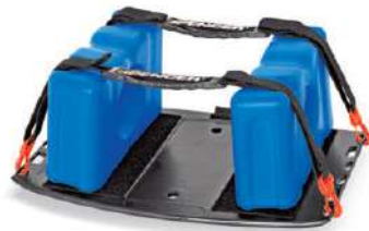
ชุดลิ้นคอง ผลิตภัณฑ์ SPENCER