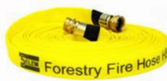
Forestry Fire Hose - HBX