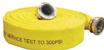
Supply Hose - PFL