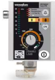
เครื่องช่วยหายใจ ผลิตภัณฑ์ WEINMANN