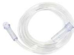
Oxygen Tube Length: 2 meters