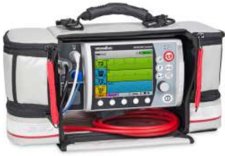
เครื่องกระตุ้นหัวใจ พร้อมมอนิเตอร์ EKG 6 ลีด ผลิตภัณฑ์ WEINMANN