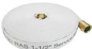
Forestry Fire Hose - HBS II - Weeping Hose/Percolating Hose