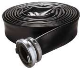
Supply Hose - PFH