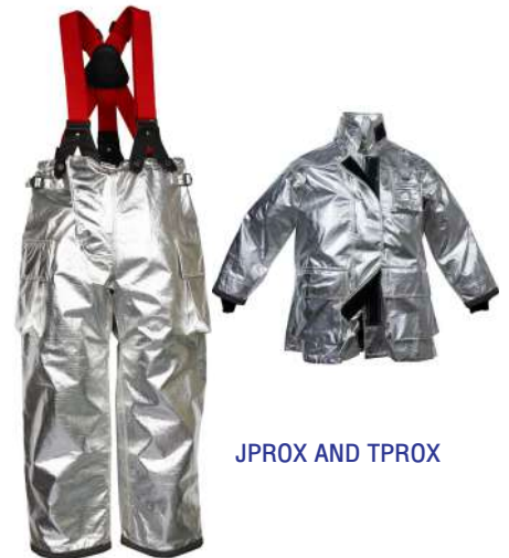
JPROX AND TPROX