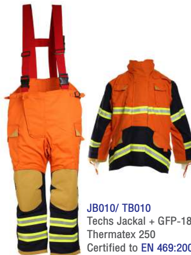
JB010/ TB010 Techs Jackal + GFP-180D + Thermatex 250 Certified to EN 469:2005