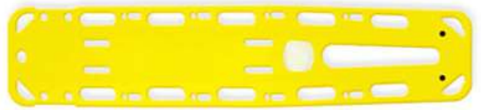
แผ่นกระดานรองหลัง Spinal Board ผลิตภัณฑ์ SPENCER