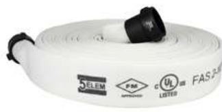
Attack Hose - FAS