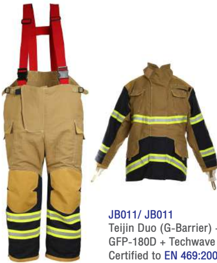
JB011/ JB011 Teijin Duo (G-Barrier) + GFP-180D + Techwave Certified to EN 469:2005