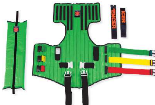
อุปกรณ์ KED ผลิตภัณฑ์ SPENCER