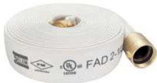
Attack Hose - FAD

สายดับเพลิง FIRE HOSE ผลิตจากวัสดุกันความร้อนอย่างดี มีลักษณะข้อต่อ ขนาด ความยาว ให้เลือกหลายหลาย