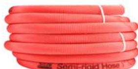
Semi - Rigid Hose - STS/SES/SPS