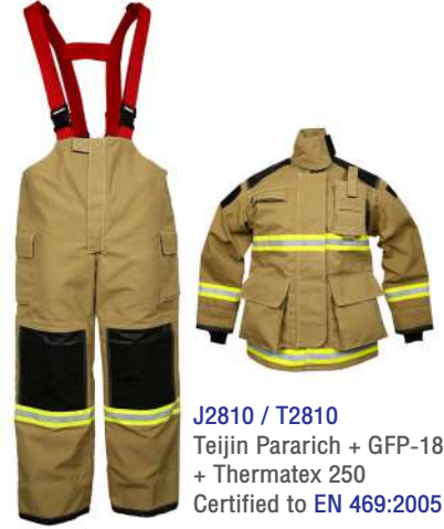
J2810 / T2810 Teijin Pararich + GFP-180D + Thermatex 250 Certified to EN 469:2005