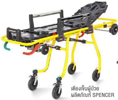
เตียงผู้ป่วย ผลิตภัณฑ์ SPENCER