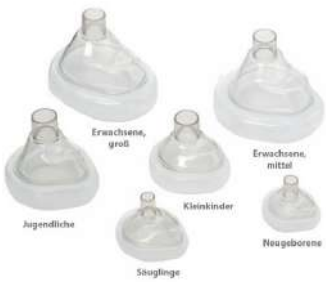
Silicone MASK size : 0, 1, 2, 3, 4, 5