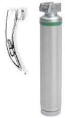
เครื่องส่งกล่องเสียง