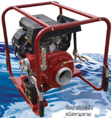
ปั้มน้ำดับเพลิง ชนิดหามหาม

ปั้มน้ำดับเพลิงพกพา เป็นปั้มน้ำขนาดเล็ก แรงดันสูง เหมาะสำหรับติดตั้งบนรถกู้ภัย หรือใช้ในการกักเฉพาะที่ไม่สามารถนำยานพาหนะเข้าไปในพื้นที่ที่เกิดเหตุได้ อาทิ การกักดับไฟป่า หรือดับเพลิงในพื้นที่แออัด เป็นต้น