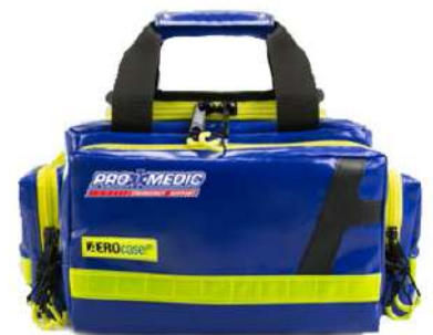
กระเป๋าพยาบาล