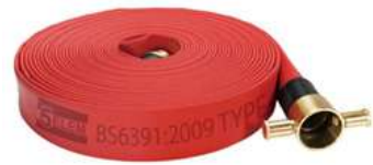
Fire Hose - BS6391 Type1 & 2