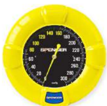
เครื่องวัดความเร็วรถ ชนิดติดผนัง ผลิตภัณฑ์ SPENCER