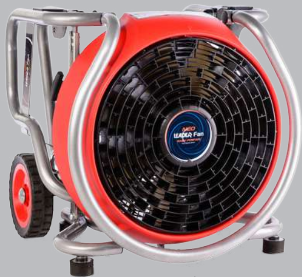
พัดลมระบายควันเครื่องยนต์ต้นกำลัง

เพื่อการกำจัดเพลิง-กู้ภัย ช่วยให้ทัศนวิสัยของผู้ปฏิบัติภารกิจชัดเจนขึ้นเคลื่อนย้ายได้สะดวก กำลังลมแรง ระบายควันได้อย่างรวดเร็ว