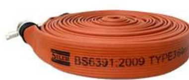
Attack Hose - DUZ