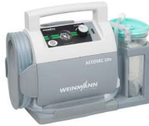
เครื่องดูดของเหลว Suction ผลิตภัณฑ์ WEINMANN