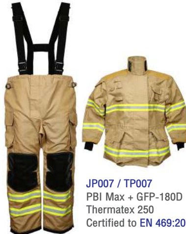
JP007 / TP007 PBI Max + GFP-180D + Thermatex 250 Certified to EN 469:2005