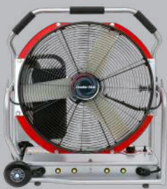
พัดลมระบายควันแบตเตอรี่