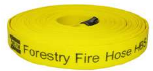
Forestry Fire Hose - HBS