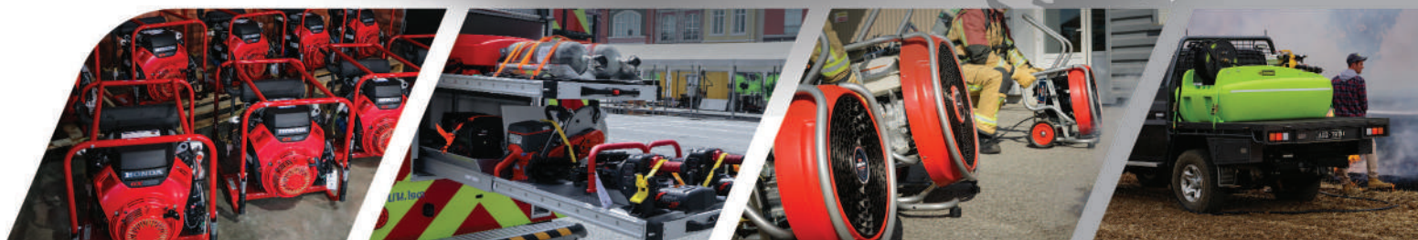
Safety ambulance • Pickup • Fire and Rescub Truck • Water tank • Portable fire pump • Low pressure water mist • TNT • Safety air cushion