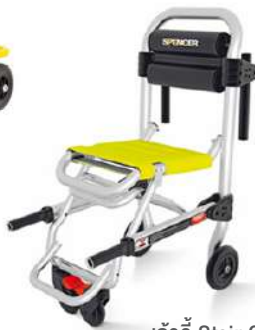
เก้าอี้ Stair Chair ผลิตภัณฑ์ SPENCER