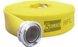
Supply Hose - RFL