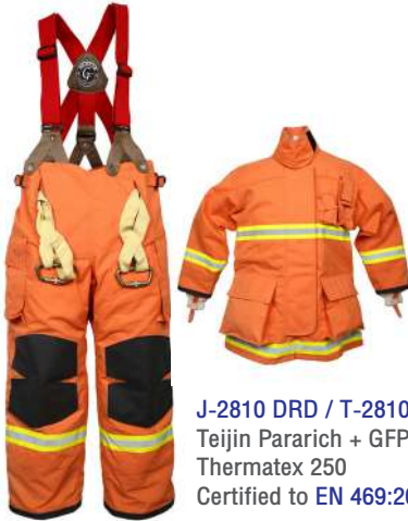
J-2810 DRD / T-2810RB Teijin Pararich + GFP-180D + Thermatex 250 Certified to EN 469:2005

ชุดดับเพลิงประจำบุคคล ผ่านการรับรองมาตรฐานชุดดับเพลิง EN 469:2005