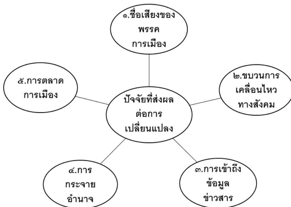
แผนภาพที่ ๒ ปัจจัยที่ส่งผลต่อการเปลี่ยนแปลงของสัมพันธภาพ ในเชิงอำนาจทางการเมืองในจังหวัดบุรีรัมย์

ทั้งนี้ จากการศึกษาพบว่า ปัจจัยที่ส่งผลต่อการเปลี่ยนแปลงของสัมพันธภาพในเชิงอำนาจทางการเมืองในจังหวัดบุรีรัมย์ อันเป็นความเปลี่ยนแปลงในเชิงอำนาจทางการเมืองในระดับท้องถิ่นที่มีความสัมพันธ์กับการเมืองในระดับชาติ โดยเฉพาะความเปลี่ยนแปลงของระบบอุปถัมภ์ การซื้อสิทธิขายเสียง กลยุทธ์ที่ใช้ในการหาเสียง การรักษาสถานเสียง รวมทั้งการสร้างเครือข่ายในรูปแบบใหม่ที่เกิดขึ้นทั้งในระดับท้องถิ่นและในระดับชาติ ทั้งนี้เกิดจากสาเหตุที่สำคัญอย่างน้อย ๕ ประการด้วยกัน ดังแผนภาพ