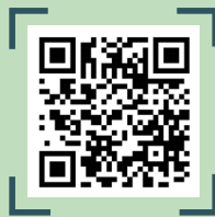
QR CODE อ่านหนังสือออนไลน์