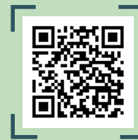
QR CODE สนใจหนังสือฉบับเต็ม หรือ ติดต่อ 0-2141-9558