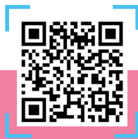
QR CODE อ่านหนังสือออนไลน์