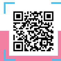
QR CODE สนใจหนังสือฉบับเต็ม หรือ ติดต่อ 0-2141-9558