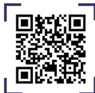
QR CODE อ่านหนังสือออนไลน์