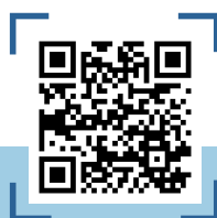
QR CODE คลัง SNAP

ดังนั้น ช่องทางการสื่อสารของรัฐสภา ที่ทำหน้าที่เป็นตัวกลางในการเผยแพร่ข้อมูลสู่ประชาชนและสาธารณะถือเป็นส่วนสำคัญในการเสริมสร้างและสนับสนุนให้ประชาชนมีส่วนร่วมทางการเมืองและเป็นการส่งเสริมการปกครองในระบอบประชาธิปไตย ช่องทางการสื่อสารต้องเข้าถึงได้ง่าย รวดเร็ว ทันสมัยตอบโต้การใช้ของผู้รับสาร ข้อมูลที่เผยแพร่ต้องเป็นข้อมูลที่ถูกต้องและเป็นปัจจุบัน มีศูนย์กลางในเผยแพร่และการให้บริการข้อมูลที่ชัดเจนผ่านช่องทางการสื่อสารต่าง ๆ ของรัฐสภา เพื่อให้ประชาชนสามารถเข้าถึงข้อมูลได้จากแหล่งเดียว และมีประสิทธิภาพมากที่สุด