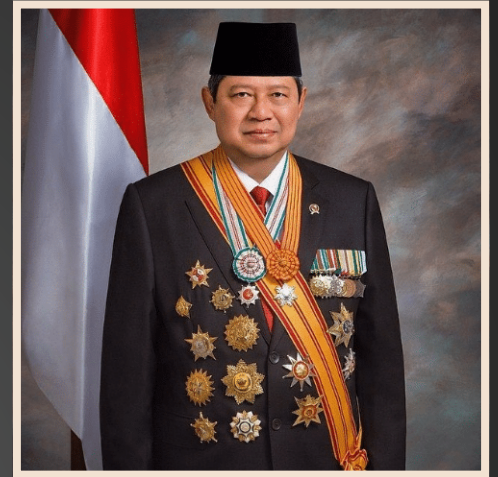
ประธานาธิบดี ซูซีโล บัมบัง ยูโดโยโน

... จากที่กล่าวมาอินโดนีเซียสามารถเรียนรู้ จากบทเรียนการปรับแก้กฎหมายครั้งนี้ ทำให้เห็นว่ากฎหมายเป็นกลไกการป้องกันการเกิดการคอร์รัปชันได้ดีที่สุด การลดบทบาทของ KPK ส่งผลทำให้ KPK มีประสิทธิภาพลดลง ทำให้เกิดการลดคะแนน ดัชนี CPI ได้ ดังนั้น หากจะจัดการปัญหาได้ตรงจุดต้องแก้ไขกฎหมายเพิ่มอำนาจจัดการ ให้ KPK อันเป็นกลไกหลักในการแก้ปัญหาคอร์รัปชัน