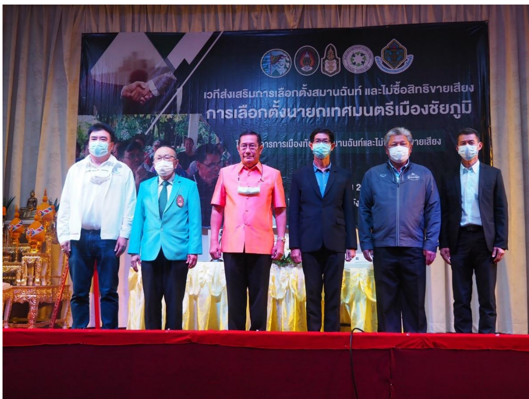
รองผู้ว่าราชการจังหวัดชัยภูมิแทนผู้ว่าราชการจังหวัดชัยภูมิ ถ่ายภาพร่วมกับผู้แทนจากสถาบันพระปกเกล้า ผู้แทนจากมหาวิทยาลัยราชภัฏชัยภูมิและผู้สมัครทั้ง 3 คน ภายหลังการบรรยายพิเศษ