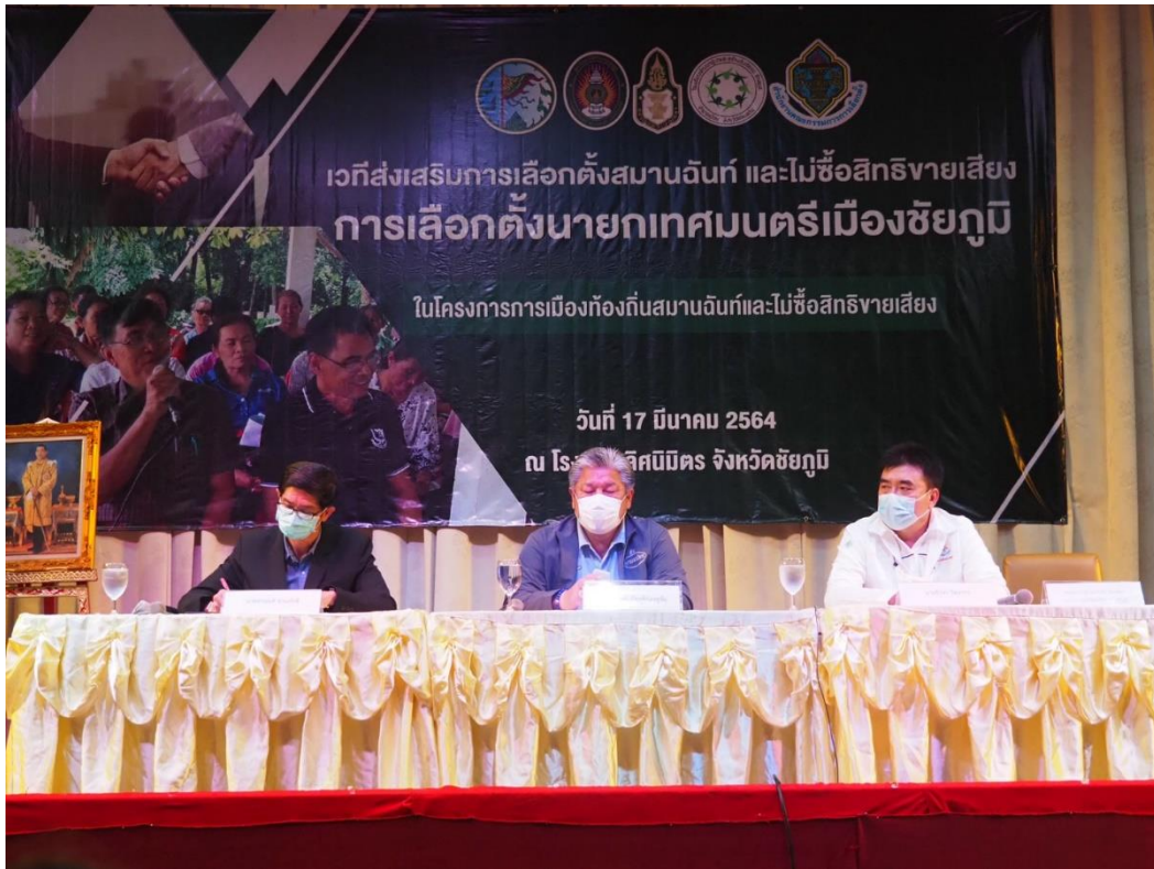
ผู้สมัครนายกเทศมนตรีเมืองชัยภูมิทั้ง 3 คนร่วมแสดงวิสัยทัศน์ในเวทีประชาเสวนา ณ โรงแรมเลิศนิมิตร