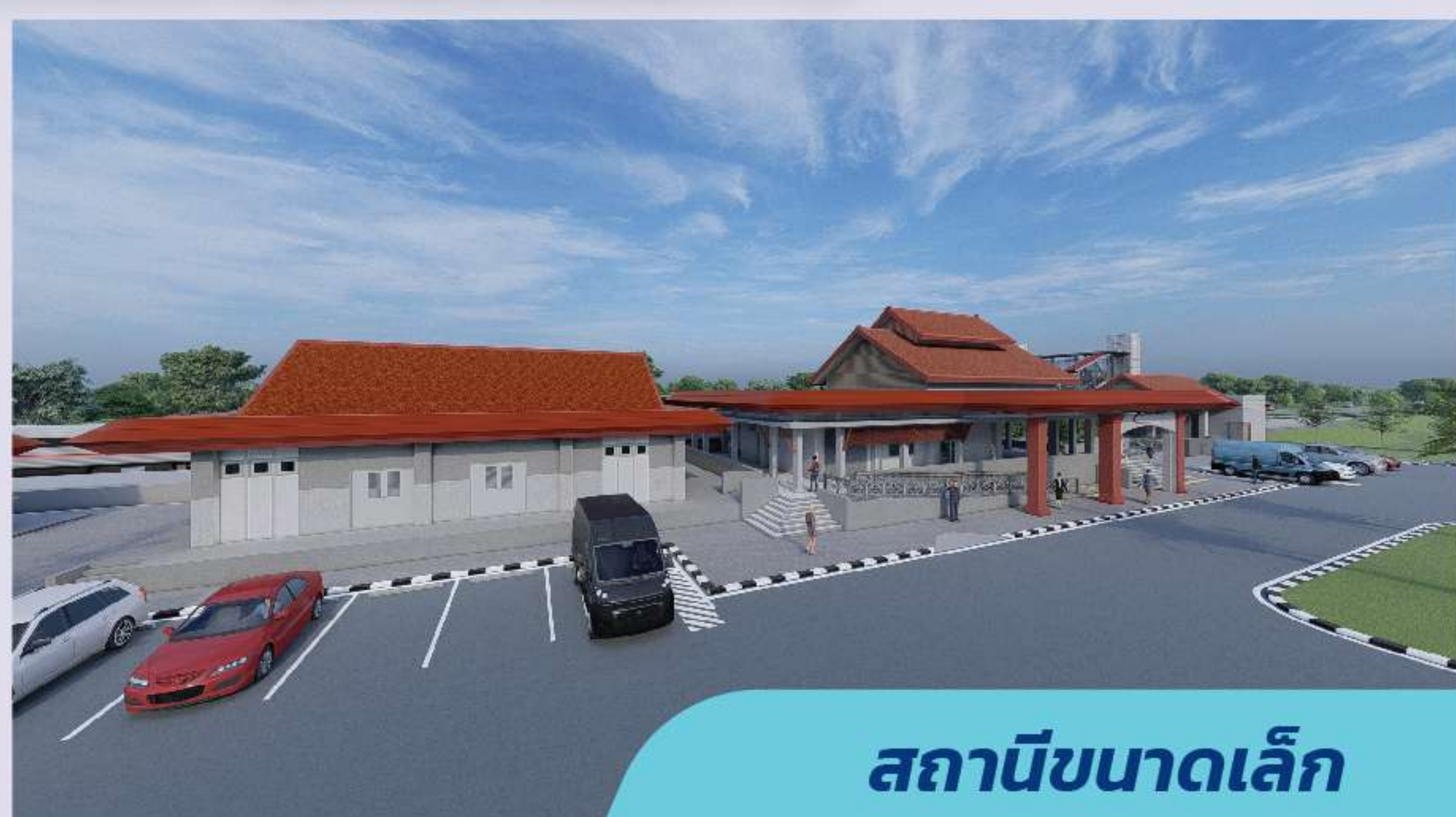
สถานีขนาดเล็ก