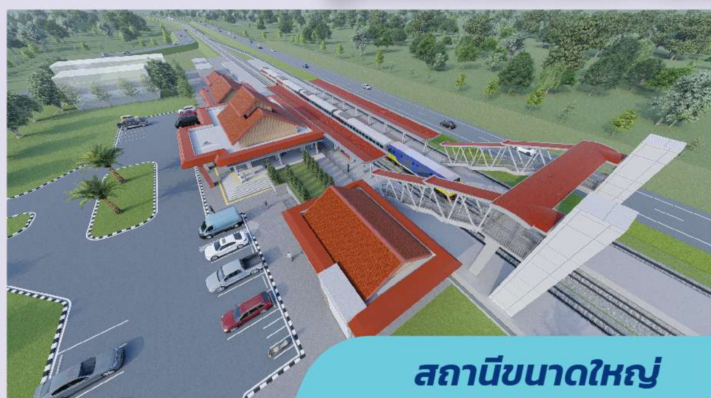
สถานีขนาดใหญ่