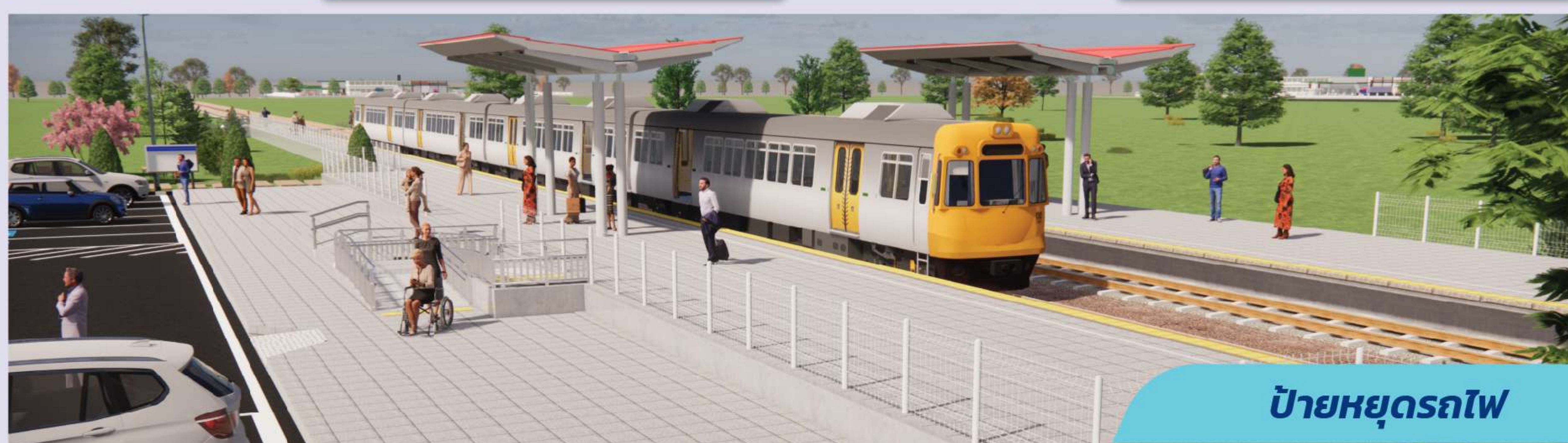
ป้ายหยุดรถไฟ