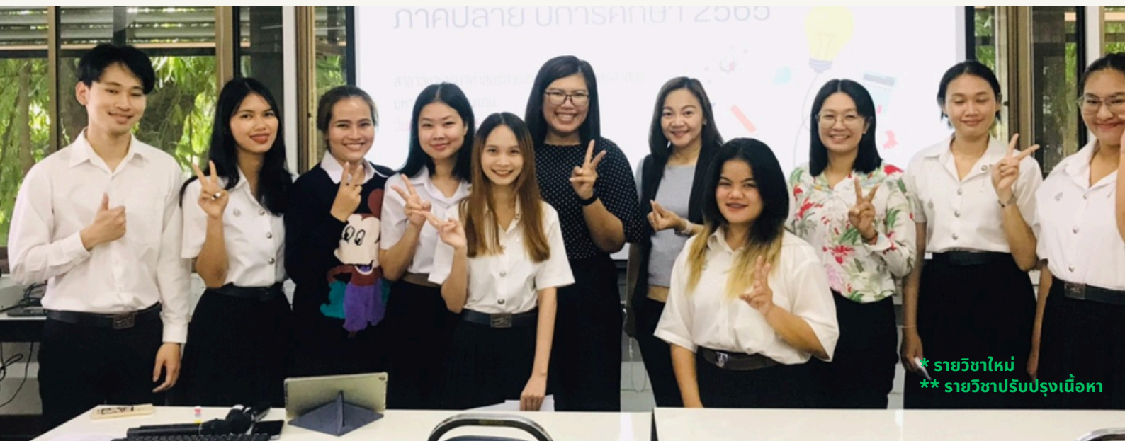
* รายวิชาใหม่ ** รายวิชาปรับปรุงเนื้อหา