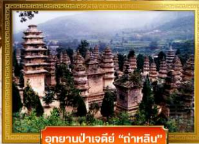
อุทยานป่าเจดีย์ "กำหลิม"