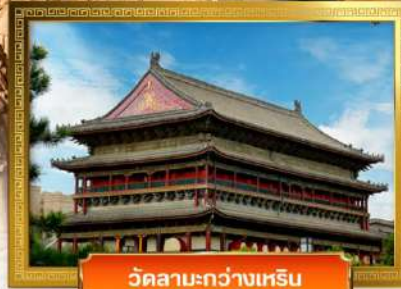
วัดลามะกว้างเหริน

เดินทางโดย: สายการบินเซินเจิ้นแอร์ไลน์ (ZH)