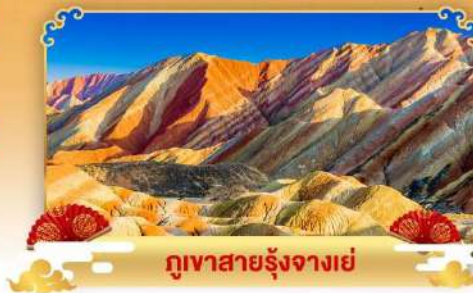
ภูเขาสายรุ้งจางเย่