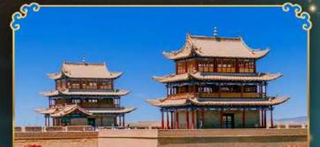
กำแพงเมืองจีนเจียวอ้วกวน