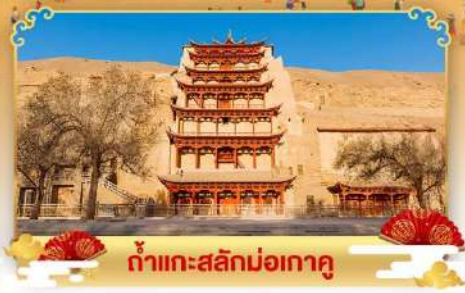
กำแพงสลักม่อเถาตู

เดินทางโดย : สายการบินโซนาแอร์ไลน์ & เซี่ยงไฮ้แอร์ไลน์