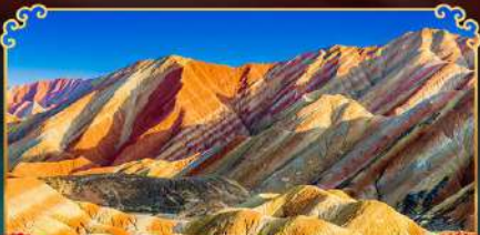
ภูเขาสายรุ้งจางเย่

เดินทางตามรอยเส้นทางสายประวัติศาสตร์โลก ชมโอเอซิสกลางทะเลทราย "ทะเลสาบพระจันทร์เสี้ยว"