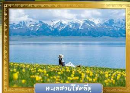
ทะเลสาบไซหลี่มู่