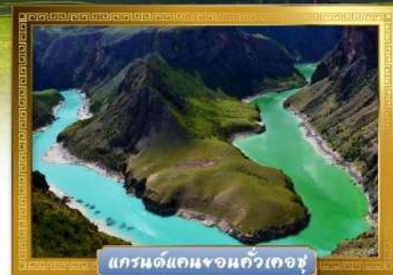
แกรนด์แคนยอนกั๋วเคอซู

เดินทางโดย : สายการบินโซนาเซาเทิร์นแอร์ไลน์