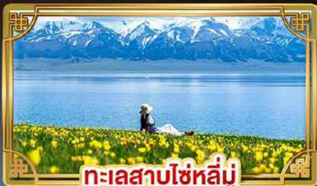
ทะเลสาบไซไห่หลู่