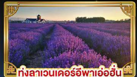
ทุ่งลาเวนเดอร์อูฟาอ้อฮัน