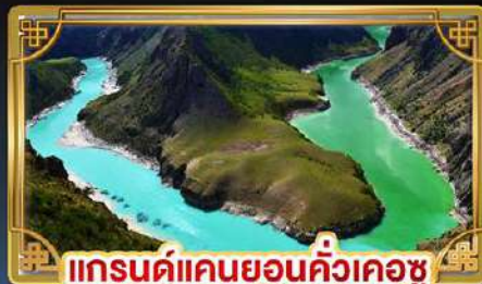
แกรนด์แคนยอนคิ้วเคอซู