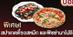
พิเศษ! สปากคดียอสมทัก และพิซชานาโปลี