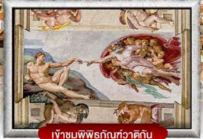
เข้าชมพิพิธภัณฑ์วาติกัน

เมนูพิเศษ! สปาเกตตี้เส้นหมึกดำ, พิชซ่าสไตล์อิตาลีเย็นแท้