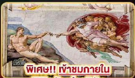
พิเศษ!! เข้าชมภายใน พิพิธภัณฑ์วาติกัน