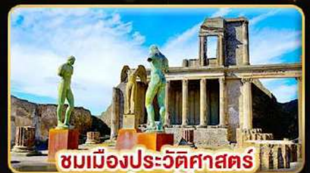
ชมเมืองประวัติศาสตร์ ปอมเปอี