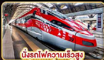
นั่งรถไฟความเร็วสูง ฟลอเรนซ์ - นาโปลี