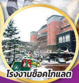
โรงงานช็อคโกแลต