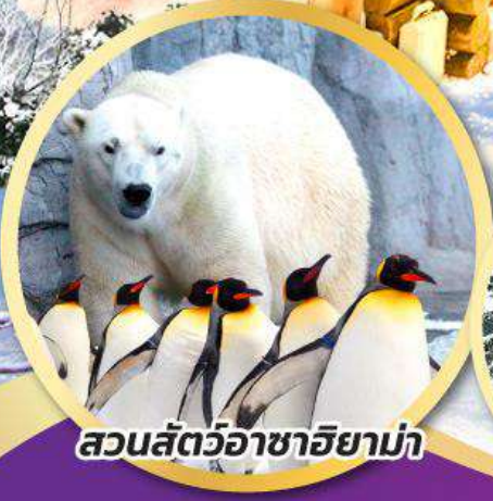
สวนสัตว์อาซาฮยาม่า