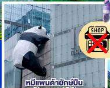
หมีแพนด้ายักษ์ปิ่น ตึกถนนชุนซีอู๋