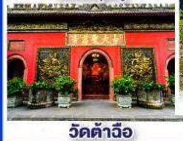
วัดต้าฉีอู๋