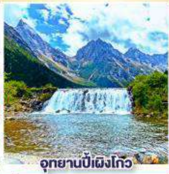
อุทยานปี้ฝิ่งโกว