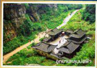
อุทยานหลุมป้อฟ้า