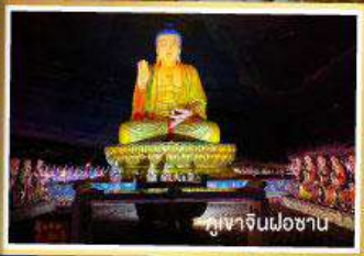
หุบเขาจินฝ่อซาน