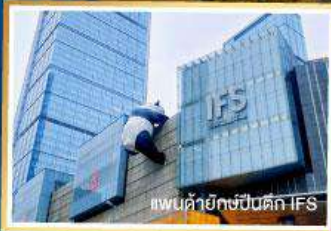
พ่นน้ำยักษ์ปีนตึก IFS