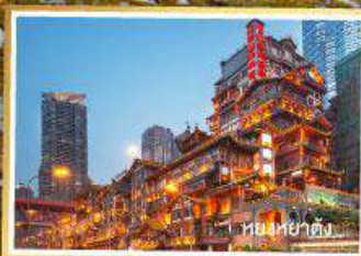
หนิงช่าต้ง