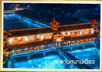
สะพานหนานเฉียว