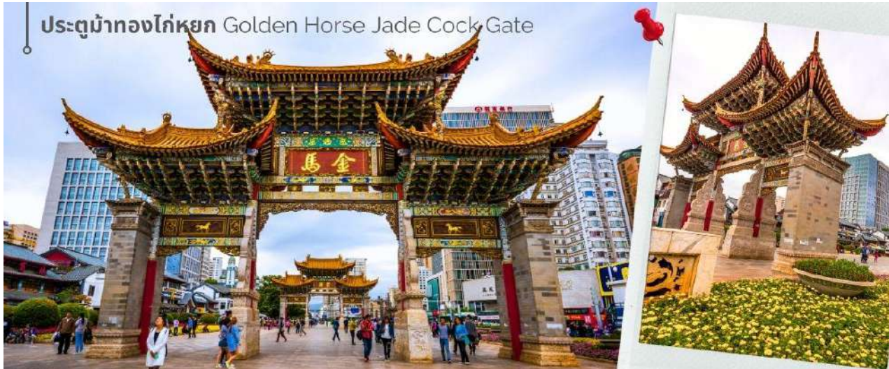
ประตูม้าทองไก่อหยก Golden Horse Jade Cock Gate

ชม ชุมประตุม้าทอง และ ชุมประตูไก่อหยก ซึ่งภาษาจีนเรียกว่าจินหม่า และปี้จี จิ้งเออคำย่อ จีนปี้ มาชานานามถนนแห่งนี้ ชุมม้าทองและไก่อหยก มีอายุร่วม 400 ปี สร้างขึ้นในสมัยราชวงศ์หมิง ในถนนย่านการค้าแห่งนี้ เป็นแหล่งเสื้อผ้าแบรนด์เนมทั้งของจีนและต่างประเทศ รวมทั้งเครื่องประดับ อัญมณี ร้านเครื่องดื่ม และร้านขายของที่ระลึกมากมาย