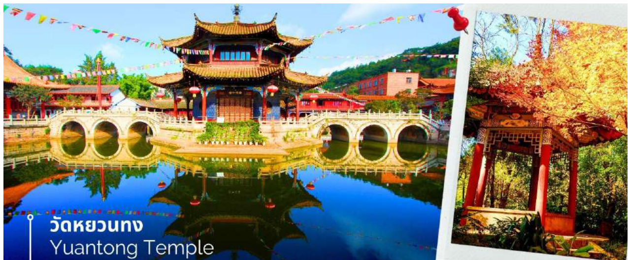
วัดหยวนทง Yuantong Temple

นำท่านชม วัดหยวนทง (Yuantong Temple) วัดแห่งนี้เป็นวัดที่ใหญ่และเก่าแก่ที่สุดในเมืองคุนหมิง สร้างมาตั้งแต่สมัยราชวงศ์ถัง มีอายุยาวนานประมาณ 1,200 กว่าปี การสร้างวัดแห่งนี้จะแปลกตากว่าวัดอื่นในจีน เพราะปกติแล้วการสร้างวัดของจีนส่วนมากจะต้องสร้างอยู่บนภูเขา แต่วัดหยวนทงสร้างวัดต่ำกว่าภูเขา โดยวิหารจะอยู่ต่ำที่สุด เนื่องจากวัดแห่งนี้ไม่ได้สร้างขึ้นเพื่อเป็นวัดโดยตรง แต่เคยเป็นศาลเจ้าแม่กวนอิมมาก่อน