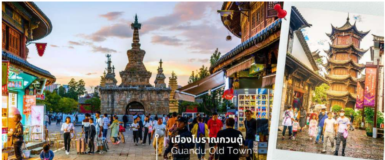
เมืองโบราณกวนตุ๋ Guandu Old Town

นำท่านชมบรรยากาศ เมืองโบราณกวนตุ๋ (Guandu Old Town) เป็นหนึ่งในต้นกำเนิดของวัฒนธรรมยูนนาน และยังถือเป็นหนึ่งในภูมิทัศน์ทางประวัติศาสตร์และวัฒนธรรม ที่สำคัญของเมืองคุนหมิง เมืองโบราณแห่งนี้ยังคงเป็นศูนย์กลางทางการค้าและคมนาคมที่สำคัญ ในอดีตเคยเป็นหมู่บ้านชาวประมงในสมัยราชวงศ์ถัง เมืองกวนตุ๋ยังเป็นเมืองแรกๆ ที่ศาสนาพุทธทางไนทิเบตได้เริ่มเผยแพร่เข้ามาในดินแดนยูนนาน