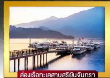
ล่องเรือทะเลสาบสุริยอันจินกรา