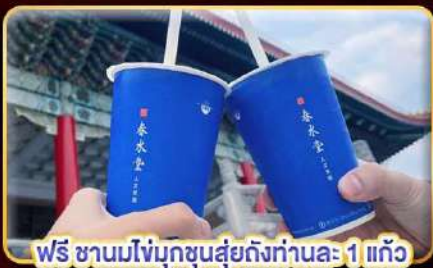
ฟรี ชานมไข่มุกชุ่นสุ่ยถึงท่านละ 1 แก้ว