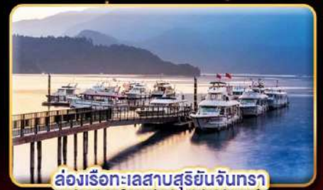
ล่องเรือทะเลสาบสุริยอันจินตรา