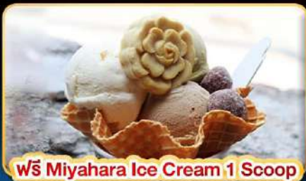
ฟรี Miyahara Ice Cream 1 Scoop

"ขอความรักวัดหลงซาน" ปล่อยคอมลอยเส้นทางรถไฟผิงซี