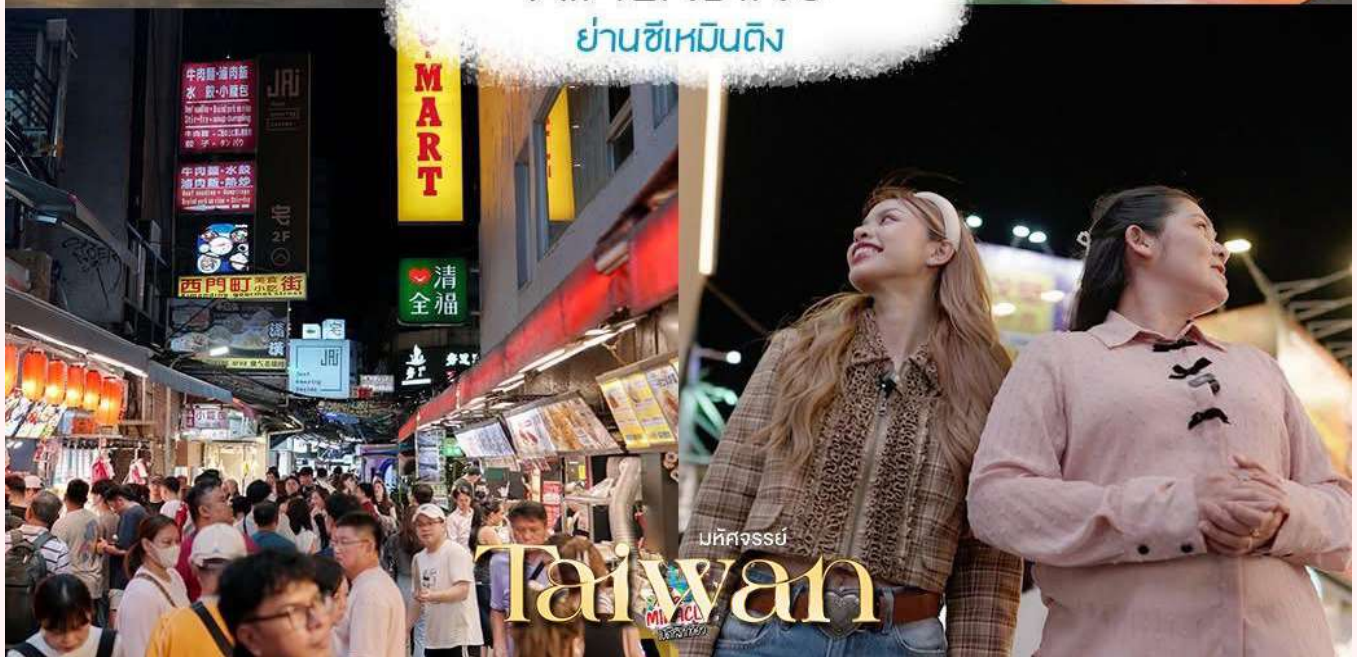
มหัศจรรย์ Taiwan