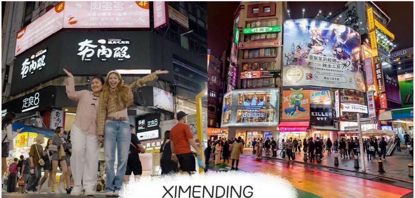
XIMENDING ย่านซีเหมินติง