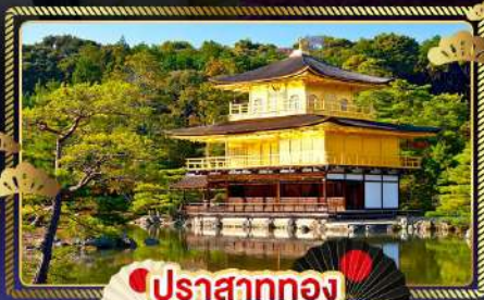
ปราสาททอง