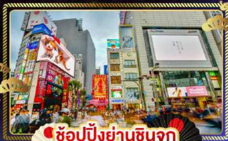
ช้อปปิ้งย่านชินจูกุ