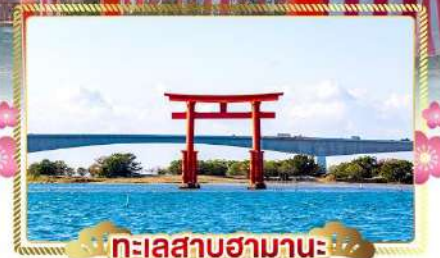
ทะเลสาบฮามานะ