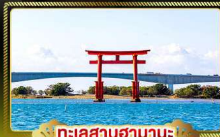
ทะเลสาบฮามานะ