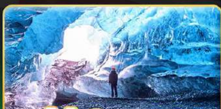
ชมถ้ำน้ำแข็งอายุกว่าพันปี