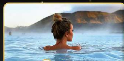
แช่น้ำแร่สุขภาพ