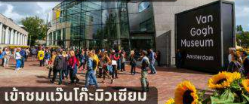
เข้าชมแวนโก๊ะมิวเซียม