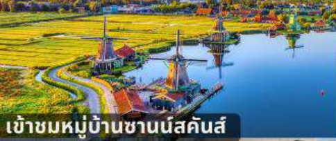
เข้าชมหมู่บ้านชานีส์คันส์