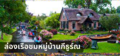
ล่องเรือชมหมู่บ้านคิฐร์น

สายการบินการตาร์แอร์เวย์ บินเข้า อัมสเตอร์ดัม บินออก ปารีส นำหนักกระเป๋า 25 กก.