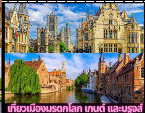
เที่ยวเมืองมรดกโลก เกนต์ และบรูจส์

ราคา รวมทุกอย่าง ไม่ต้องจ่าย หน้างาน ตั๋วเครื่องบิน-โรงแรม-อาหาร-ทิปโถด-ทิปคนขับ-ประกันฯลฯ