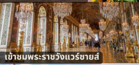
เข้าชมพระราชวังแวร์ซายส์