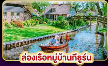
ล่องเรือหมู่บ้านกังหัน