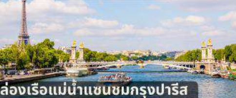
ล่องเรือแม่น้ำแซนชมกรุงปารีส