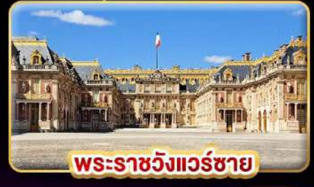
พระราชวังแวร์ซาย