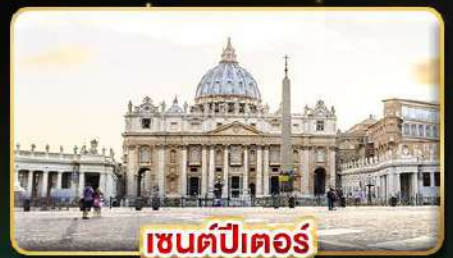
เซนต์ปีเตอร์