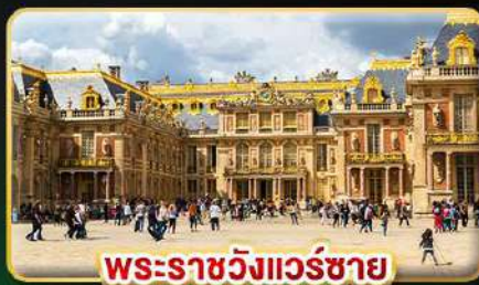
พระราชวังแวร์ซาย