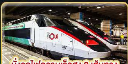
นั่งรถไฟความเร็วสูง 2 เส้นทาง PARIS - LYON & VENICE - ROME

📅 เดินทาง : 11-20 ก.พ. 68 | 15-24 มี.ค. 68