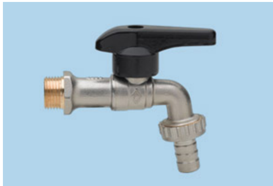
ก๊อกบอลแบบมีเดือย ด้ามจับแบบอลูมิเนียม