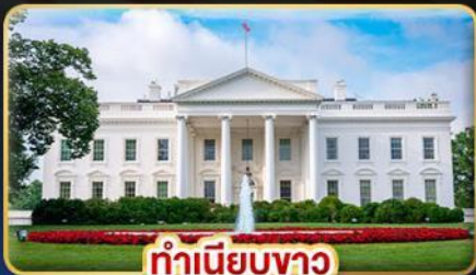
ทำเนียบขาว