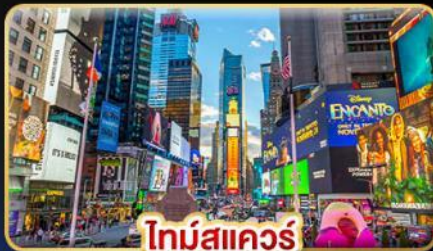
ไทม์สแควร์