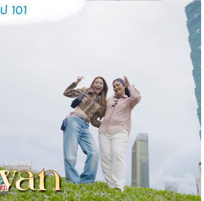
มหัศจรรย์ Taiwan