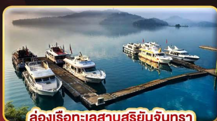
ล่องเรือทะเลสาบสุริยอันจนตรา