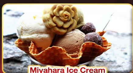
Miyahara Ice Cream