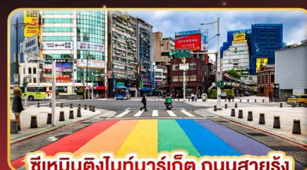
ซีเหมินติงไนท์มาร์เก็ต ถนนสายรุ้ง