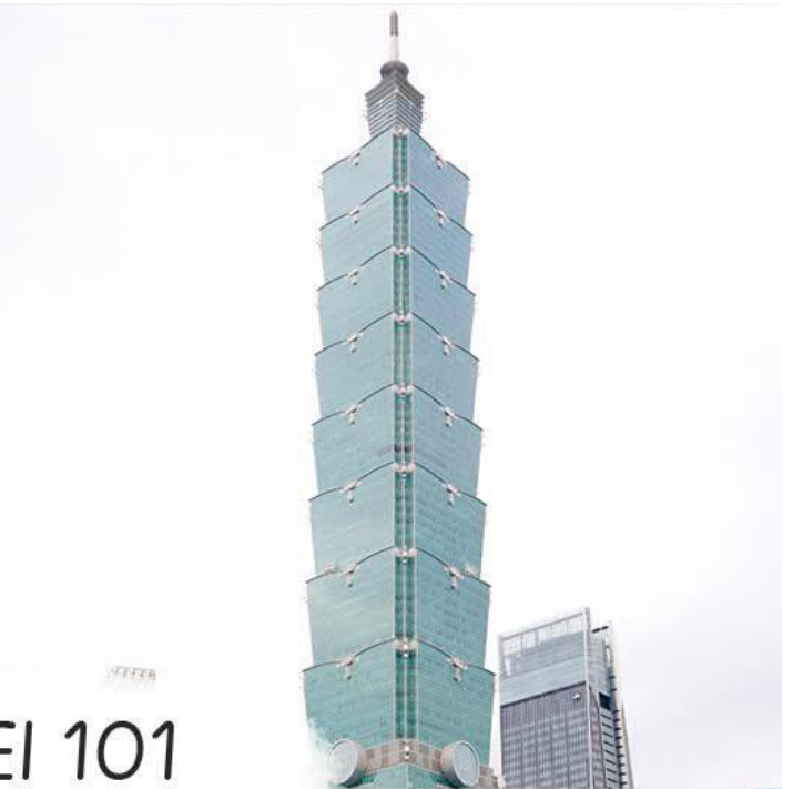
TAIPEI 101 ตึกไทเป 101