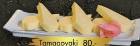
Tamagoyaki 80.- ไข่หวาน