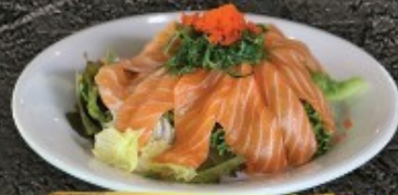
Salmon Yam 250.- ซาโมซากะซอซุ