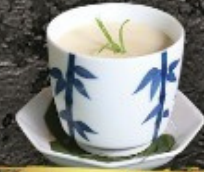
Chawanmushi 80.- ไข่ตุ๋น