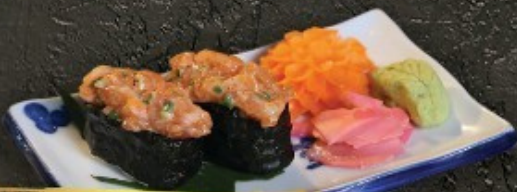
Spicy Salmon Sushi 80.- สปีซี่ แซลมอน ชูชิ