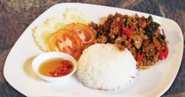
พัดก:เพรารหมูราดข้าว 150.-