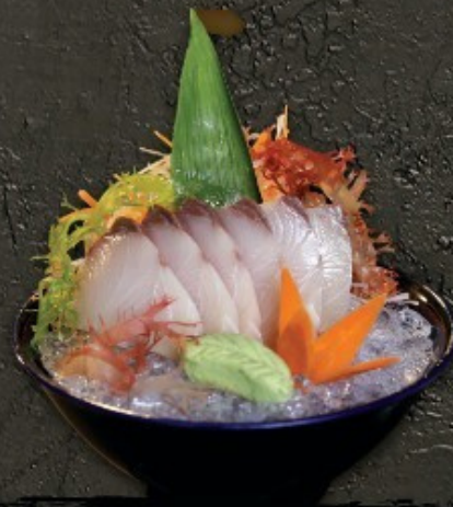
Hamachi Sashimi 400.- ฮามาจิ ซาชิมิ