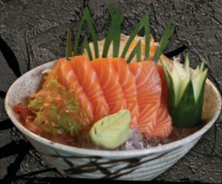
Salmon Sashimi 350.- แซลมอน ซาชิมิ