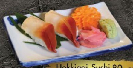
Hokkigai Sushi 80.- หอยเม่นสด ชูชิ