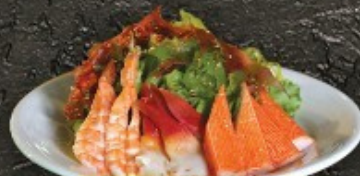
Kaiso Salad 220.- สลัดสาหร่าย