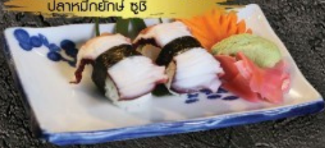
Tako Sushi 80.- ปลาหมึกย่าง ชูชิ