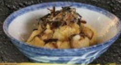
Agedashi Tofu 110.- เต้าหู้ทอด