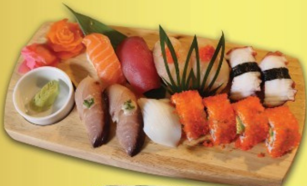
Tayama Sushi A 550.- ប្រាក់ប្រាក់ ត្រី