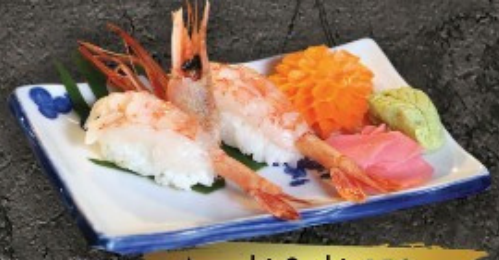
Amaebi Sushi 150.- ត្រីត្រី ត្រី