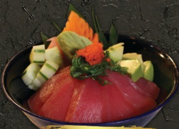
Tekka Don 300.- ข้าวหน้าปลาทูน่า