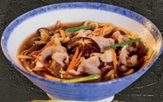
Niku Udon/Soba 150.- อุด้งหมู/เนื้อ