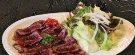
Niku Tataki 250.- ซาโมซากะย่างญี่ปุ่น