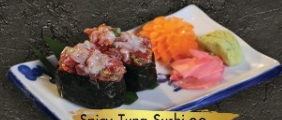
Spicy Tuna Sushi 80.- สปีซี่ ทูน่า ชูชิ