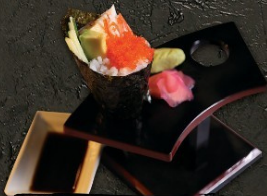
California Temaki 120.-