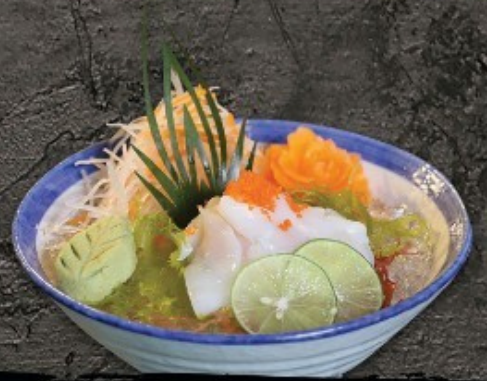
Ika Sashimi 250.- ปลาหมึก ซาชิมิ