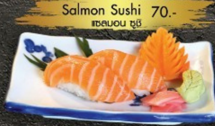
Salmon Sushi 70.- ត្រីសាឡាម៉ូន ត្រី