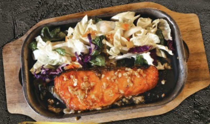
Salmon steak 280.- แซลมอนสเต็ก