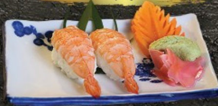
Ebi Sushi 70.- ត្រីឌីប ត្រី