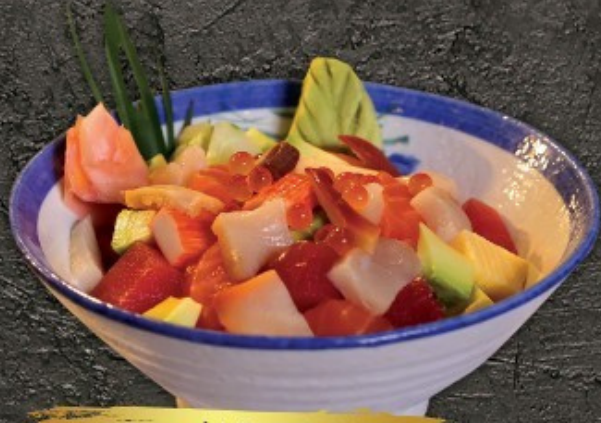
Barashi Don 320.- ข้าวหน้าปลาดิ้นหั่นเต๋า