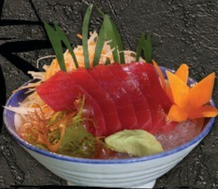
Tuna Sashimi 380.- ทูน่า ซาชิมิ