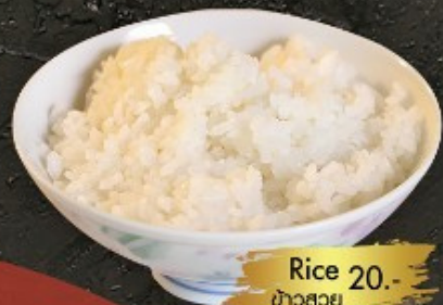
Rice 20.- ກິດ