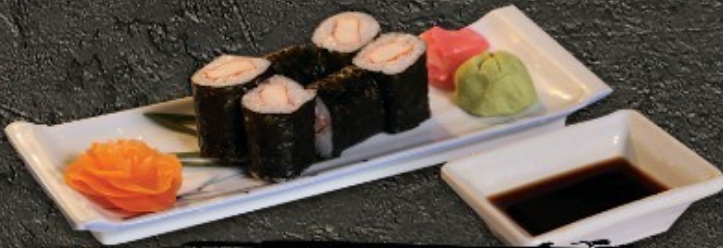
Kani Maki 100.- ข้าวห่อสาหร่ายใส่ปูอัด