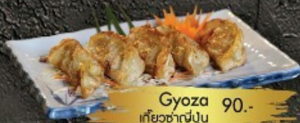
Gyoza 90.- เกี้ยวซ่าญี่ปุ่น