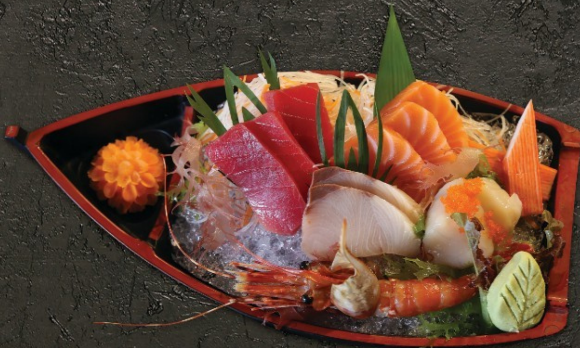
TAYAMA Sashimi B 800.- ປາລາດີບຣວນ ເຊດ B