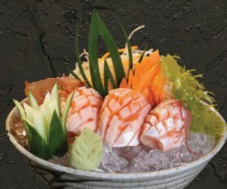
Salmon Toro Sashimi 300.- ท้องปลาแซลมอน ซาชิมิ