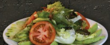
Avocado Salad 150.- สลัดคาโงะชิ