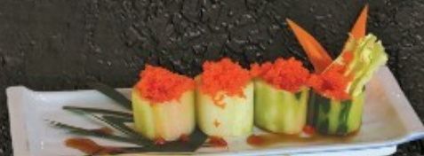
Salad Maki 80.- สลัดเตงกวา