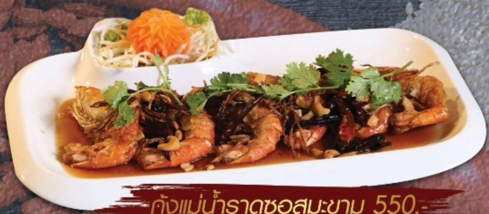
กุ้งแม่น้ำราดซอสมะขาม 550.-