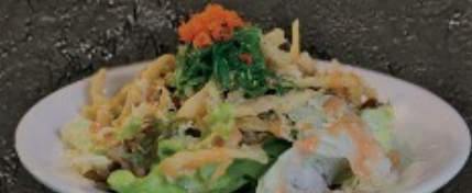
Crispy Salad 250.- สลัดปลาแซลมอน