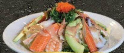
Salad Cream 220.- สลัดมายองเนส