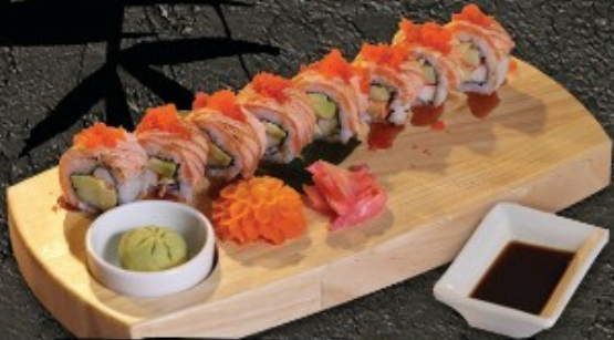
Yakimaki Roll 320.- ข้าวห่อสาหร่ายย่าง