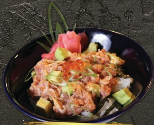
Negi Maguro Don 300.- ข้าวหน้าปลาดิ้นสับ