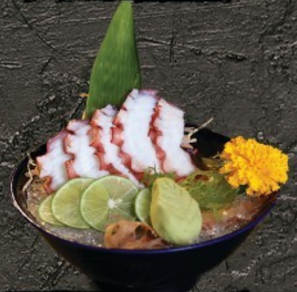
Tako Sashimi 350.- ปลาหมึกยักษ์ ซาชิมิ