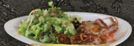
Yawara Salad 250.- สลัดญี่ปุ่น