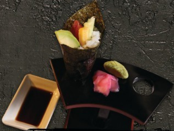
Tuna Temaki 120.-