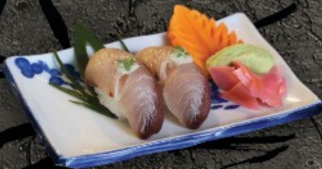
Hamachi Sushi 100.- តាមាឆី ត្រី