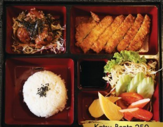
Katsu Bento 250.- ກັດສິ ແບໂຕ: