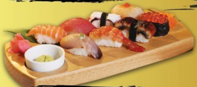
Tayama Sushi B 450.- ប្រាក់ប្រាក់ ត្រី