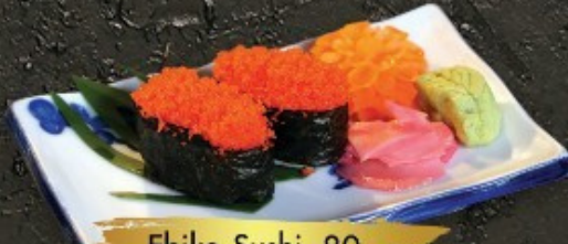
Ebiko Sushi 80.- ត្រីឌីប ត្រី