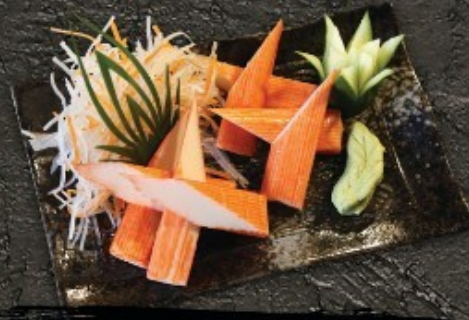
Kani Sashimi 160.- ปูอัด ซาชิมิ