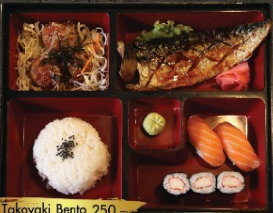
Takoyaki Bento 250.- ຕັກອຸຍັກິ ແບໂຕ: