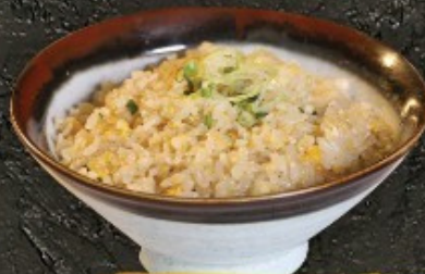
Ninniku Rice 30.- ນິນນິກຸ ກິດ