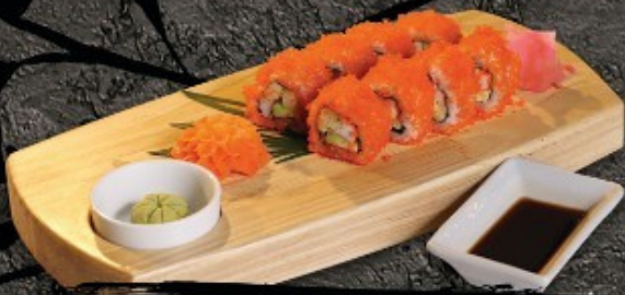
California Roll 300.- ข้าวห่อสาหร่ายคุดไข่กุ้ง