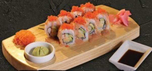
Ebi Roll 320.- ข้าวห่อสาหร่ายกุ้ง