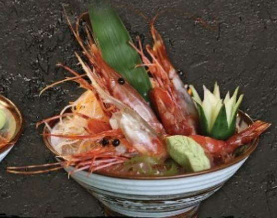
Botan Ebi Sashimi 350.- กุ้งโบตัน ซาชิมิ