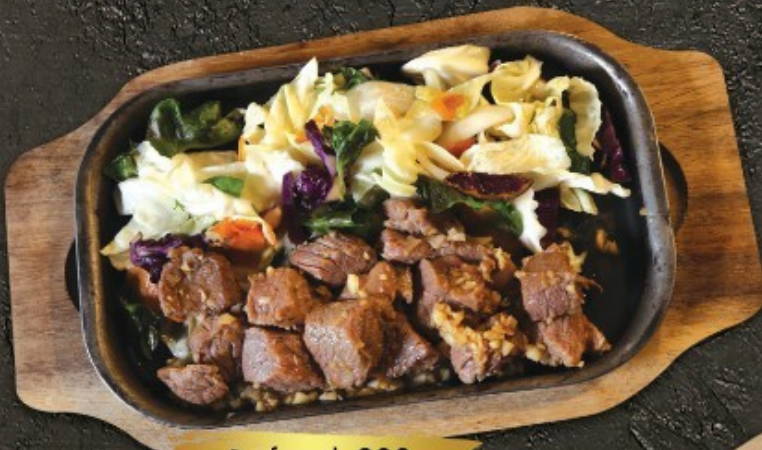
Beef steak 280.- สเต็กเนื้อ