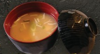
Miso Soup 20.- ມິສອຸປູ