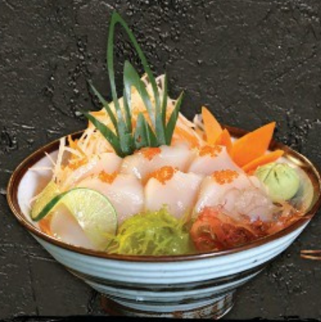
Hotate Sashimi 400.- หอยเชลล์ ซาชิมิ