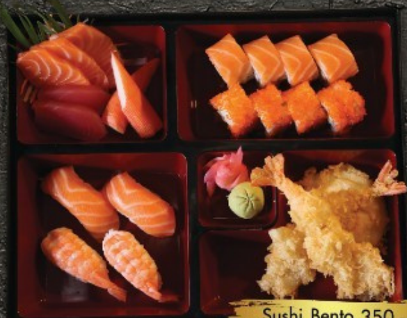
Sushi Bento 350.- ຮູສິ ແບໂຕ: