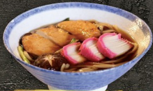
Kamaboko Udon/Soba 150.- ก๊วยเตี๋ยวลูกชิ้นปลาต้มปู