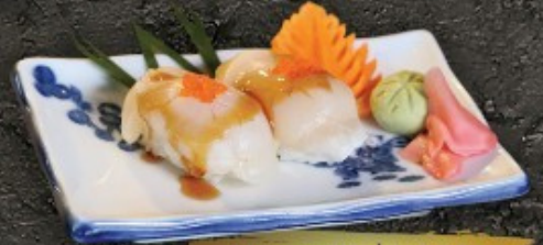
Hotate Sushi 150.- ត្រីហតាតេ ត្រី