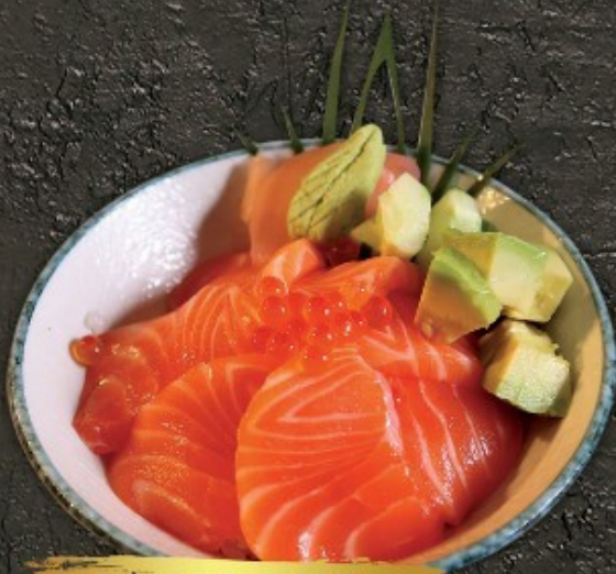
Salmon Don 300.- ข้าวหน้าปลาแซลมอน