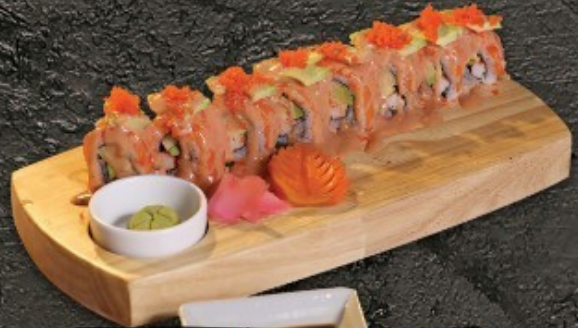
Salmon Roll 320.- ข้าวห่อแซลมอนอะโวกาโด