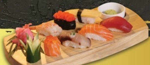
Tayama Sushi C 350.- ប្រាក់ប្រាក់ ត្រី