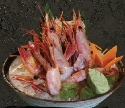
Amaebi Sashimi 350.- กุ้งหวาน ซาชิมิ