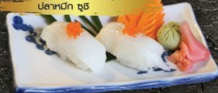
Ika Sushi 70.- ปลาหมึกดิบ ชูชิ