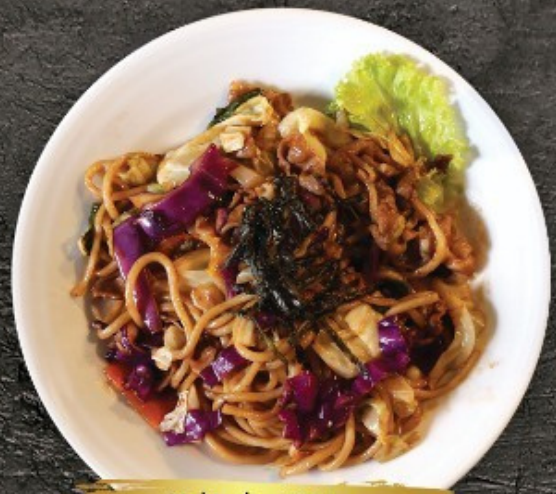
Yakisoba 150.- ยากิโซบะ