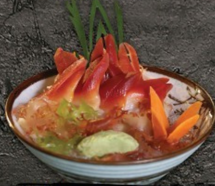
Hokkigai Sashimi 350.- หอยมีกนก ซาชิมิ