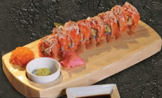
Crazy Roll 320.- เครซี่โรล