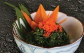
Hiyashi Wakame 150.- สาหร่ายแช่เย็น