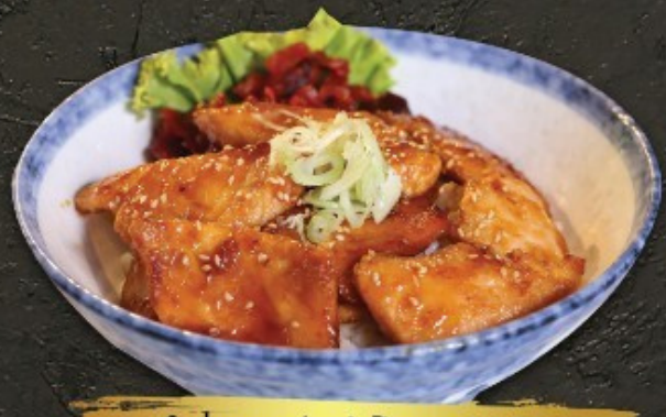
Salmon Ami Don 280.- ข้าวหน้าปลาแซลมอนพริกอบหวาน