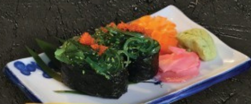
Hiyashi Sushi 80.- เย็นซ่า ร่าย ชูชิ