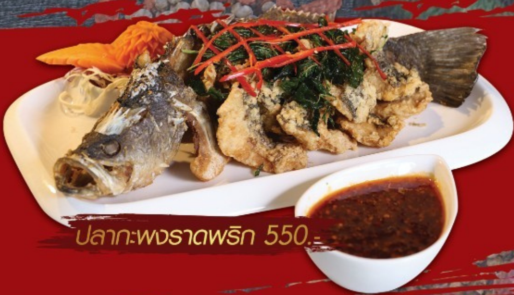
ปลา:พวงราดพริก 550.-