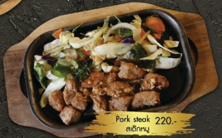
Pork steak 220.- สเต็กหมู