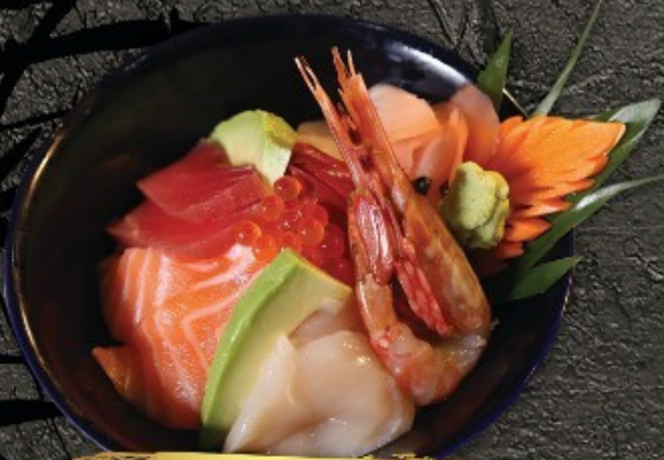
Chirashi Don 350.- ข้าวหน้าปลาดิ้นรวม