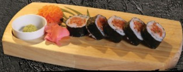
Spicy Salmon Roll+Tuna 250.- สไปซี่ โสร