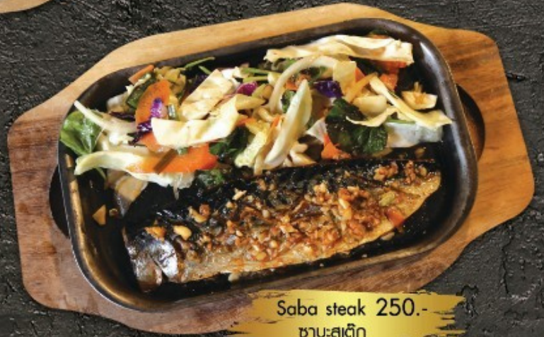
Saba steak 250.- ซาบะสเต็ก