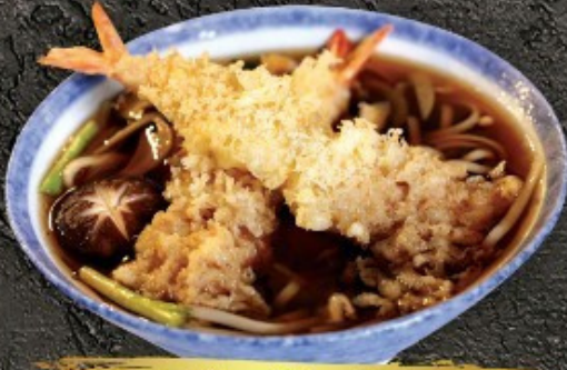
Tempura Udon/Soba 150.- เทมปุระ: อุด้ง/โซบะ