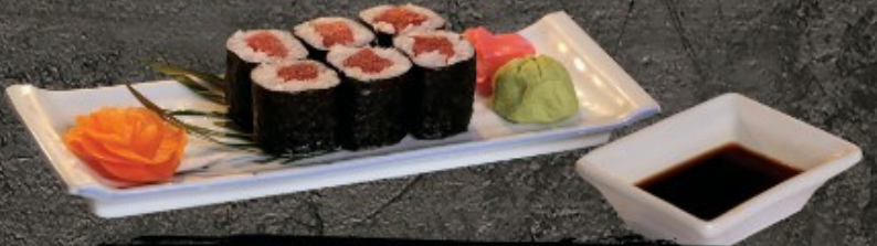
Teka Maki 120.- ข้าวห่อสาหร่ายใส่ทูน่า