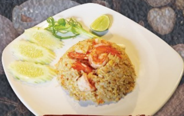
ข้าวพัดกุง 150.-