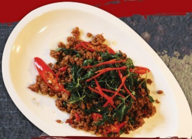
หมูพัดก:เพรารอบ 200.-