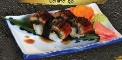
Unagi Sushi 140.- ปลาไหลย่าง ชูชิ