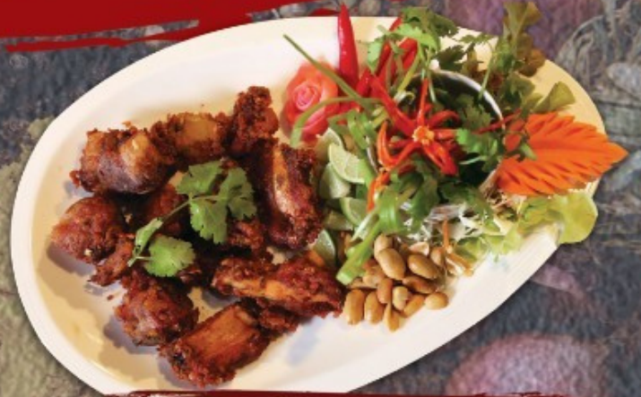
หมูมันซี่โครงหมู 220.-