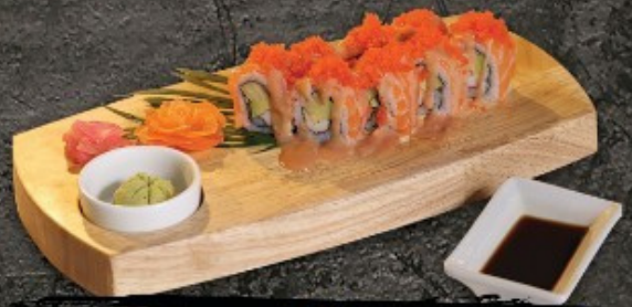
Tayama Roll 320.- รามาโร