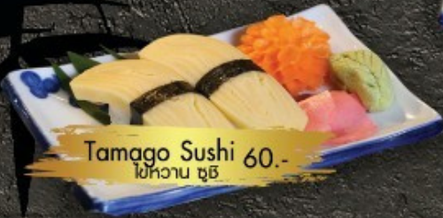
Tamago Sushi 60.- ត្រីតាមាឆី ត្រី