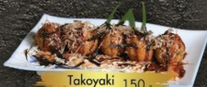
Takoyaki 150.- ขนมครกญี่ปุ่น