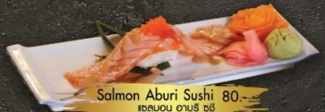
Salmon Aburi Sushi 80.- ត្រីសាឡាម៉ូន ត្រី