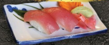
Tuna Sushi 80.- ทูน่า ชูชิ