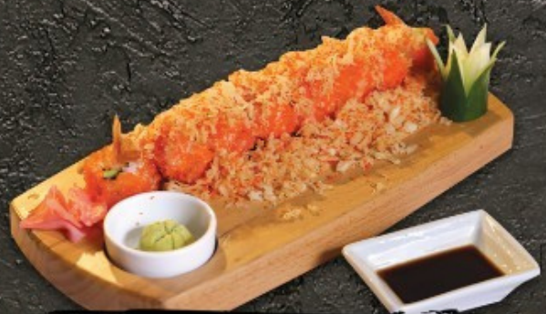
Tempura Roll 320.- ข้าวห่อสาหร่ายกุ้งเทมปุระ