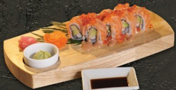
Alaska Roll 320.- อลาสกาโรล