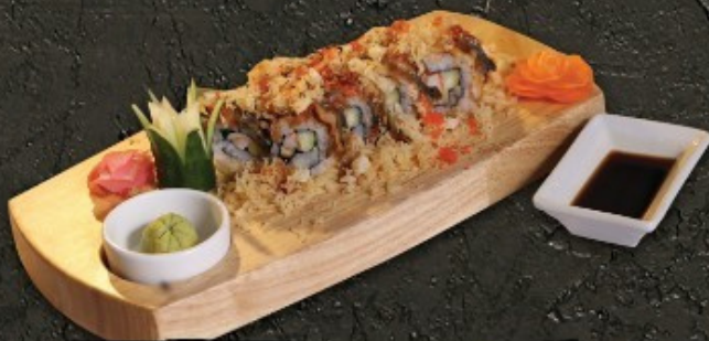
Unagi Roll 320.- ข้าวห่อสาหร่ายปลาไหลญี่ปุ่น