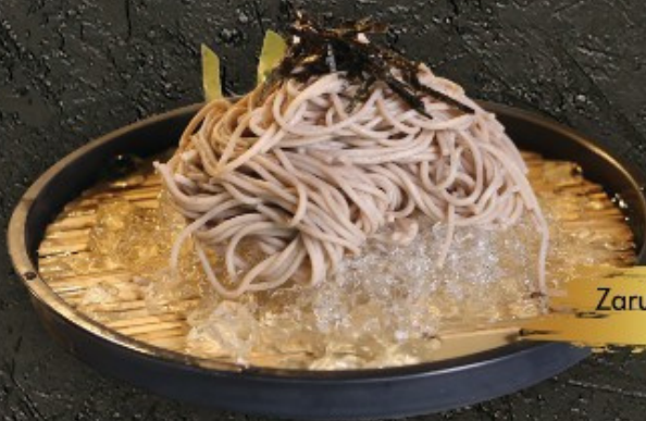
Zaru Udon/Soba 110.- บะหมี่เย็น