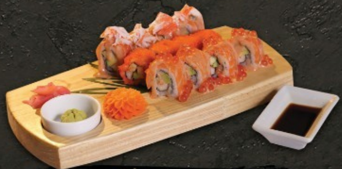
Maki Mix 400.- ข้าวห่อสาหร่ายรวม