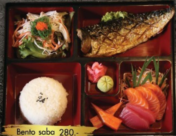
Bento saba 280.- ແບໂຕ: ສາບ