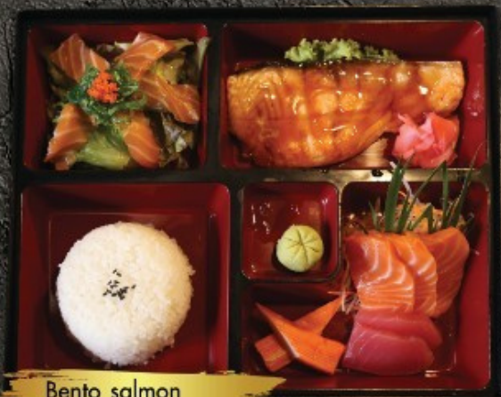
Bento salmon ແບໂຕ: ອອສອນ