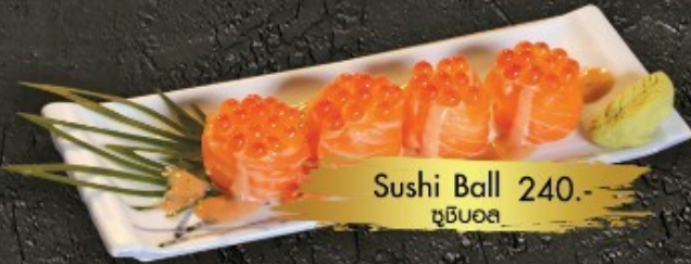
Sushi Ball 240.- ត្រីប៊ូល