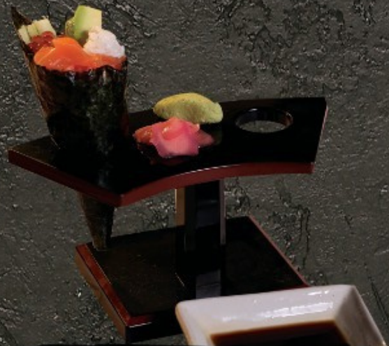
Salmon Temaki 120.-