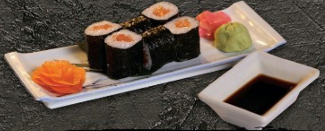
Salmon Maki 120.- ข้าวห่อสาหร่ายใส่แซลมอน