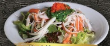
Kani Yam 150.- ซาโมซากะ