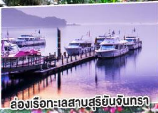
ล่องเรือทะเลสาบสุริยันจันทราร