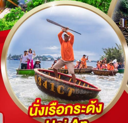
นั่งเรือกระดิ่ง Hoi An