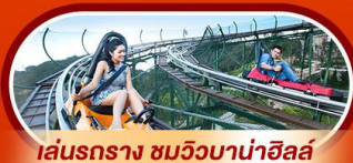
เล่นรถราง ชมวิวบานาฮิลล์