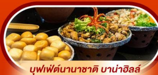
บุฟเฟต์นานาชาติ บานาฮิลล์