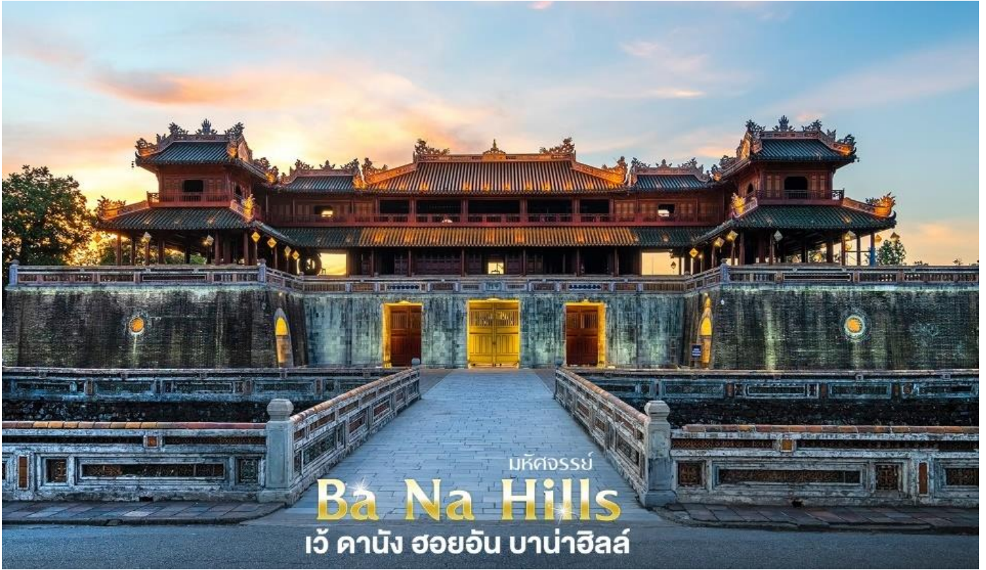
มหัศจรรย์ Ba Na Hills เว้ ดานัง ฮอยอัน บาน่าฮิลล์

Tel. 098-8428194, 097-2982329 Facebook: @Helloholidaytrip Instagram: Helloholidaytrip Line ID: @Helloholidaytrip www.helloholidaytrip.com