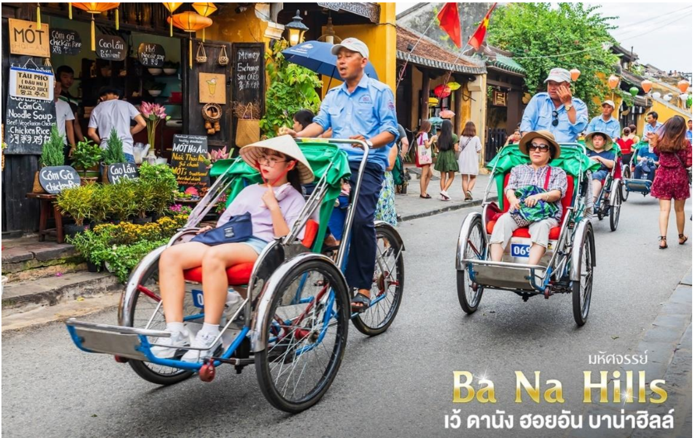
มหัศจรรย์ Ba Na Hills เว้ ดานัง ฮอยอัน บาน่าฮิลล์