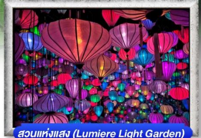
สวนแห่งแสง (Lumiere Light Garden)