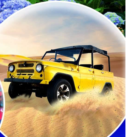
ฟรี! นั่งรถจี๊ป