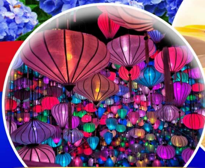
สวนแห่งแสง (Lumiere Light Garden)