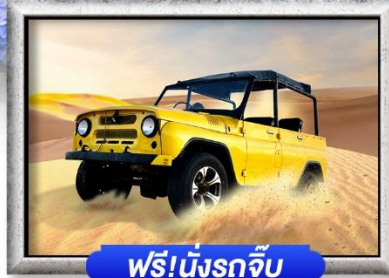
ฟรี!นั่งรถจี๊ป