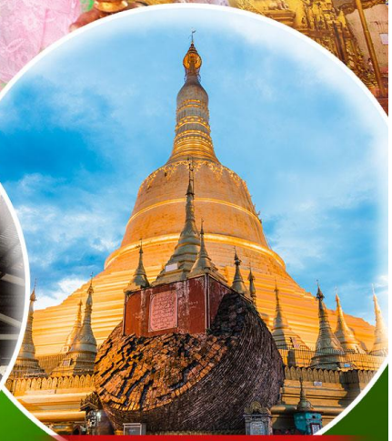
พระธาตุมุเตา