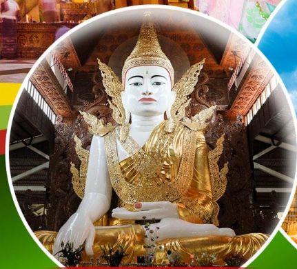
พระหงาทัดจี